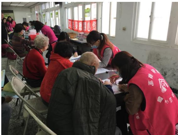
社區整合性篩檢(成老人健檢及癌症篩檢)