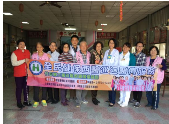
偏遠地區(屏東竹田)巡迴醫療