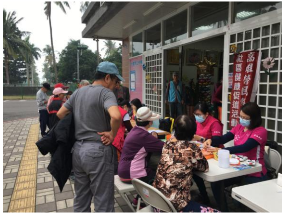
社區關懷站三高檢測