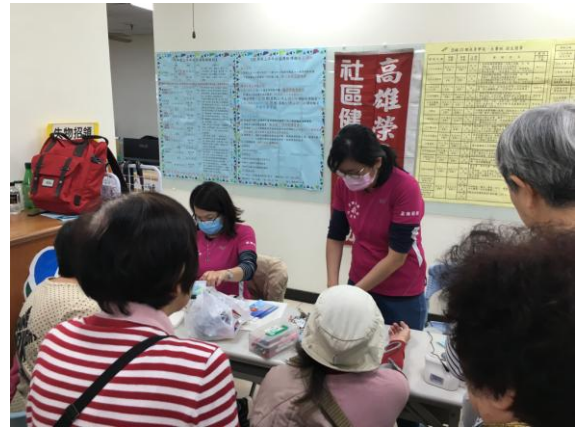
社區關懷站三高檢測