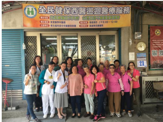
偏遠地區(屏東九如)巡迴醫療