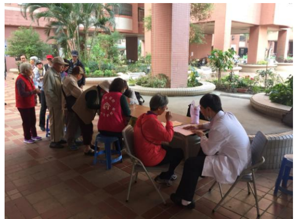
成老人健檢第二階諮詢