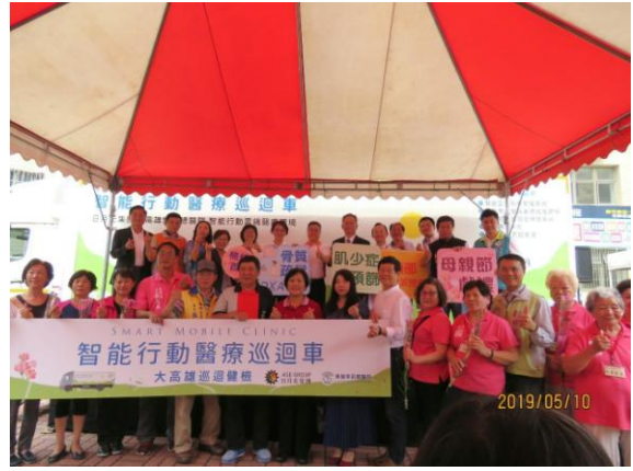
智能行動醫療巡迴車啟航