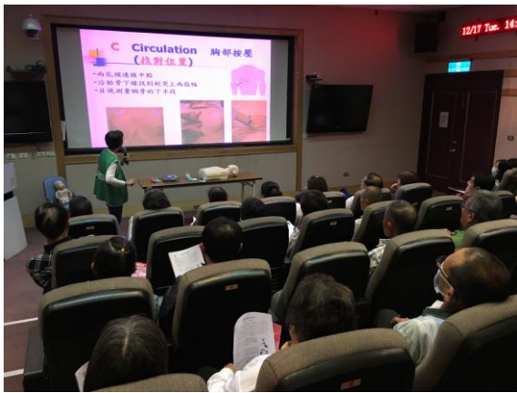
社區居民急救教育訓練