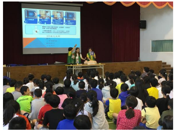
校園學生急救教育訓練