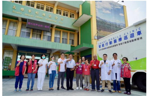
智能行動醫療巡迴車偏遠地區義檢