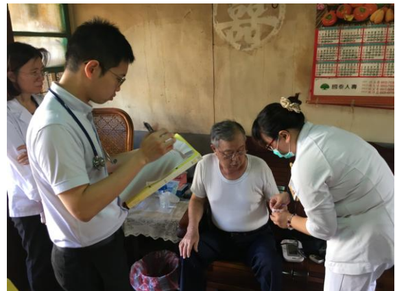
屏東九如巡迴醫療關懷訪視