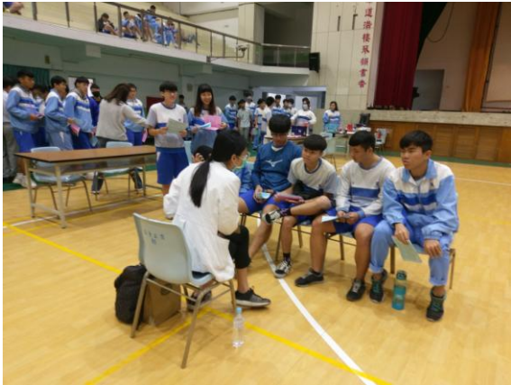
校園流感疫苗注射