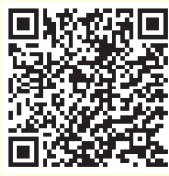
高雄榮總醫訊 電子期刊