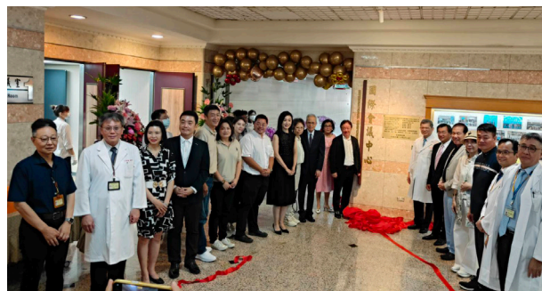
國際會議中心開幕典禮

智慧會議室升級，完成 5 間會議室 (第一、二、三、四、五會議室) 改建，打造具國際水準之優質會議環境。第一會議室配備「南台灣唯一 600 吋 LED 超大螢幕」、AI 智慧影音系統、數位麥克風及無線簡報設備。第三會議室為「智慧未來教室」，可串聯第一會議室，具備 AI 錄影直播與數位互動功能，提升承辦大型醫學會議、國際論壇與遠距會診教學的能力。