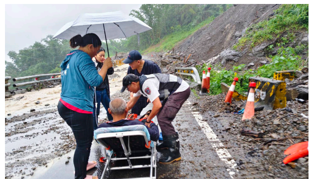
與那瑪夏鄉衛生所共同緊急轉診

2025 年 8 月 1 日，派駐那瑪夏醫師透過視訊會診研判為重症個案，與衛生所人員冒雨突破路阻完成緊急轉診救命。9 月 23 日花蓮馬太鞍溪堰塞湖溢流事件，派遣醫師隨高雄市特搜隊前往投入現場緊急醫療處置，守護民眾健康。