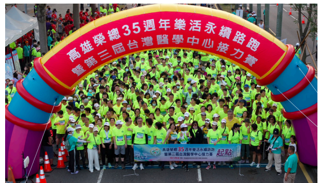
樂活永續路跑活動暨第三屆台灣醫學中心接力賽

以高榮 35 永續共舞為主軸，召開 12 次籌備會議。系列活動共 10 場次國際研討會、9 場醫學暨學術研討會、9 場成果發表會 / 講座、院慶暨醫師節、員工健康促進活動 13 場、其他院慶系列活動 14 場，樂活永續路跑活動暨第三屆台灣醫學中心接力賽（共 1,753 人，包括 50 隊