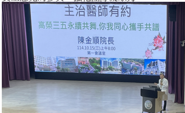
院長與主治醫師有約

此外，2025 年舉辦 3 場「主治醫師有約」，院長與主治醫師面對面建立真誠溝通的橋樑，共同研商醫療發展策略，讓醫院前進的政策有員工意見的參與，強化團隊凝聚力。