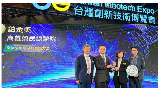
台灣創新技術博覽會鉑金獎

持續精進臨床流程與品質管理，多項醫療品質指標穩定，包括急診超過 48 小時暫留率、三日內再急診率及門診手術後再就醫率等，皆優於高屏區醫學中心平均水準，展現組織在高負荷環境下仍能維持穩定、安全與高品質照護的治理韌性。在品質精進方面，透過品管圈與實證導向改善機制，系統性強化跨團隊協作與問題解決能力。團隊於醫策會、台灣醫療品質協會、先鋒基金會全國品管圈大會、全國金銀獎品管圈選拔及 ICQCC（台灣）等多項評選中屢獲肯定。鼓勵發展特色醫療及參與 SNQ 競賽，2025 年共有 16 個團隊榮獲標章。同時醫院積極將創新能量導入臨床與管理實務，參與台灣創新技術博覽會共榮獲 1 鉑金（奈米眼藥水平台 - 亦榮獲第 22 屆國家新創獎 - 學研新創獎）、1 金、1 銀及 2 項銅獎，高雄 KIDE 國際發明暨設計展榮獲 1 鉑金及 3 項金獎肯定，充分展現醫療創新與臨床應用並進的發展動能。