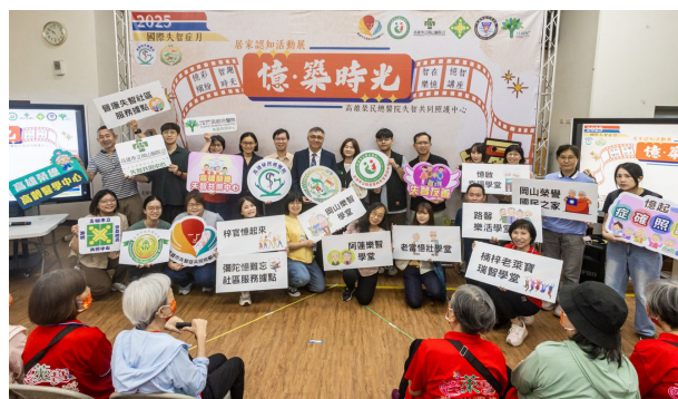
第二屆「憶·築時光」居家認知活動展

積極推動社區失智照護服務，於社區共設置 12 處失智社區據點，累計服務 24,302 人次，有效延伸醫療專業至社區端。其中，在本院專業輔導下，2 處據點榮獲高雄市政府衛生局考