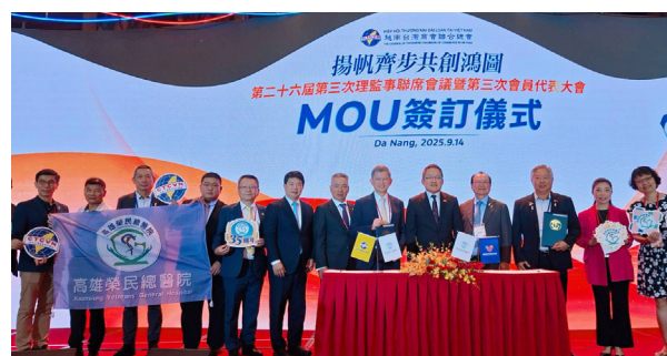
打造台商友善就醫通道

2025 年共服務 2,492 人次，積極推動跨國專業交流，與越南 SIS 醫院、越南鴻德醫院及 One Health Foundation 簽定 MOU、辦理 21 場國際研討會共 1,204 人次參與，與越南台灣商會聯合總會簽署合作備忘錄及越南僑界關懷協會建立「跨國緊急後送機制」，海外急症啟動「返台就醫一條龍服務」，展現在國際醫療服務的行動力。2025 年 12 月派 6 員長駐越南慶和省醫院 1 個月，進行台越醫療專業能量提升與國際合作推動計畫，建立臨床照護準則及病歷系統資訊化建置進行交流。