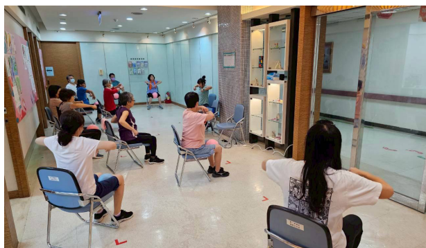
高齡樂齡學院 - 心活力健康操 + 舞動體適能

以及眼科與耳鼻喉科門診動線改造等工程，優化就醫環境。於急診大樓 2 樓設置「急診留觀中繼病房」，有效提升急診照護效率與品質。整合門診衛教室為「綜合衛教室」，提供營養師、藥師及個管師跨專業共用之多元服務空間。多元學習空間再利用，原醫療大樓傳統醫學門診區暫改設為「高齡樂齡學院」，首期招收 64 位學員，為期 3 個月，課程涵蓋肌力運動、營養衛教、手作創意與健康園藝等多元主題，推動醫療空間活化與長者終身學習並行，展現醫院推動健康老化的創新實踐。