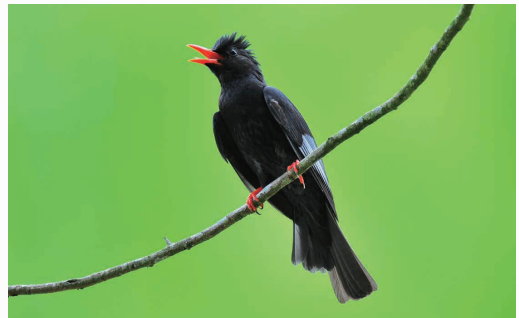
圖三：紅嘴黑鶇有黑色的蓬鬆冠羽