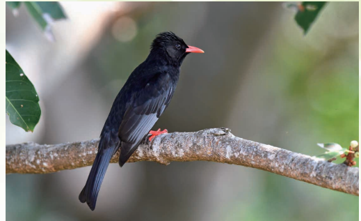
圖一：紅嘴黑鶇身體羽色的特徵

生態：紅嘴黑鶇的食物有種子和昆蟲，經常成群或棲或飛尋找食物，特別喜歡吃莓果（圖四）。紅嘴黑鶇相當喧鬧，常發出大聲的「喵—、喵—」的貓叫聲或「小氣鬼、小氣鬼」或「噦--喳、噦--喳」叫聲，多出現於闊葉林和耕地區，築巢於樹木或灌木，一鳥窩有2至4個蛋。紅嘴黑鶇有一項奇妙的習性，冬季氣溫降低時，許多鳥兒會往較低海拔處移動，到比較溫暖的地方過冬，可是紅嘴黑鶇卻反而有往較高海拔處移動的傾向。這種現象稱作「反降遷」，可能是為了要進駐其他鳥類降遷避冬之後空下的棲息空間，當其他鳥兒變少了，相對來說取得食物的機會便會增加，紅嘴黑鶇也就能在冬天的山上大快朵頤。