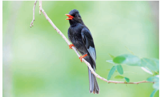
圖二：像被燙傷嘴紅、腳紅的紅嘴黑鶇