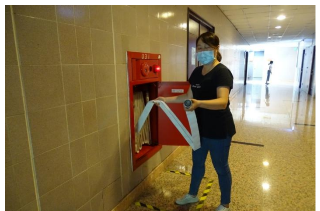
滅火班消防栓操作