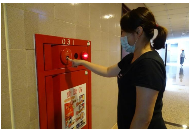
滅火班消防栓操作