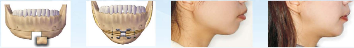
● 圖4：視須要進行骨片移植以加長下巴長度，再用骨釘骨板固定。

採用口內切口，前庭部分，約3~4公分左右，將下巴骨切開後，移除部份下巴骨而後向中心窄縮，並視須要進行骨片移植以加長下巴長度，再用骨釘骨板固定。一般手術時間約1~2個小時，以全身麻醉施行手術，而術後飲食，流質食物約3~5天，之後換成軟質食物約1~2星期。