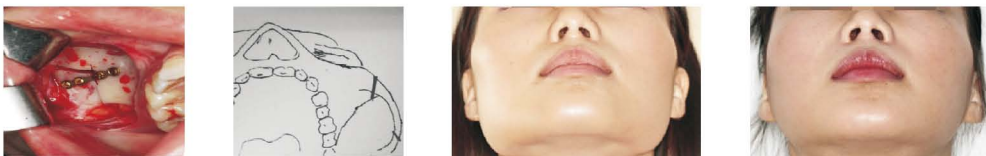
圖2：將顴骨弓內推，適時地作鈦合金鋼板的固定

顴骨雕塑手術，可以說是一種人造顴骨骨折後，再固定到一個比較窄縮的位置，一般顴骨雕塑手術是採用口內切口合併耳前約一公分左右的切口，耳前切口可藏在髮際裡，口內的切口讓我們可以作一個眼眶外側的顴骨體骨切開和固定，耳前髮際的切口讓我們可以作顴骨的骨切開。一般手術時間約1.5個小時，以全身麻醉施行手術，而術後飲食，流質食物約3-5天，之後換成軟質食物約1-2星期。