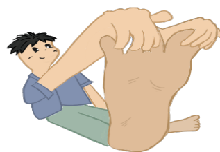
(圖二) 維持足底向上扳 15 秒 休息 5 秒再進行第二次

一手握住大姆指另一手握住其餘四根腳趾，向上扳起15秒，休息5秒再進行第二次共運動10分鐘，再換腳做。