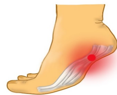
(圖一) 足底筋膜炎好發處