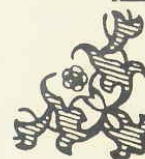
「實證醫學(EBM)文獻查證應用類推廣組」金獎獎狀