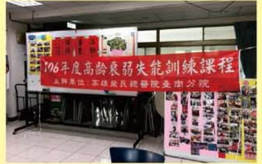
▲106年高齡衰弱失能課程

本院的高齡醫學科與社區健康發展中心，由本院醫療團隊藉由與社區的連結，將醫療服務延伸至社區，共同努力營造社區友善的環境，進而能夠服務更多的民眾。