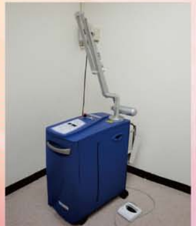
▲白瓷娃娃雷射(淨膚雷射)機種、效用▼