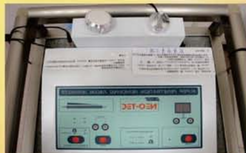
▲超音波美白導入儀