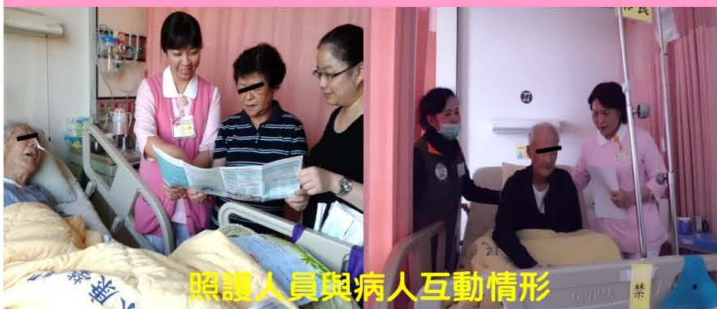
照護人員與病人互動情形