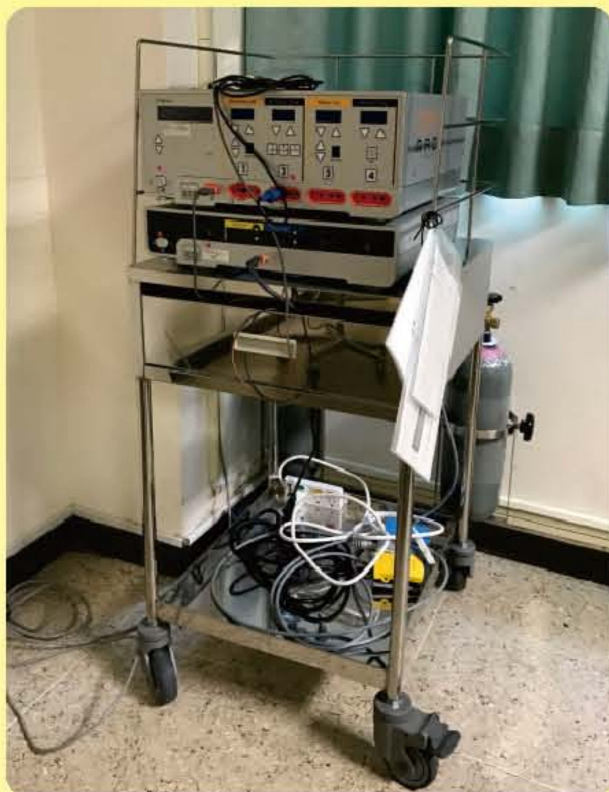
▲電燒器(輔助用於內視鏡檢查中，切除欲切除的病灶)。