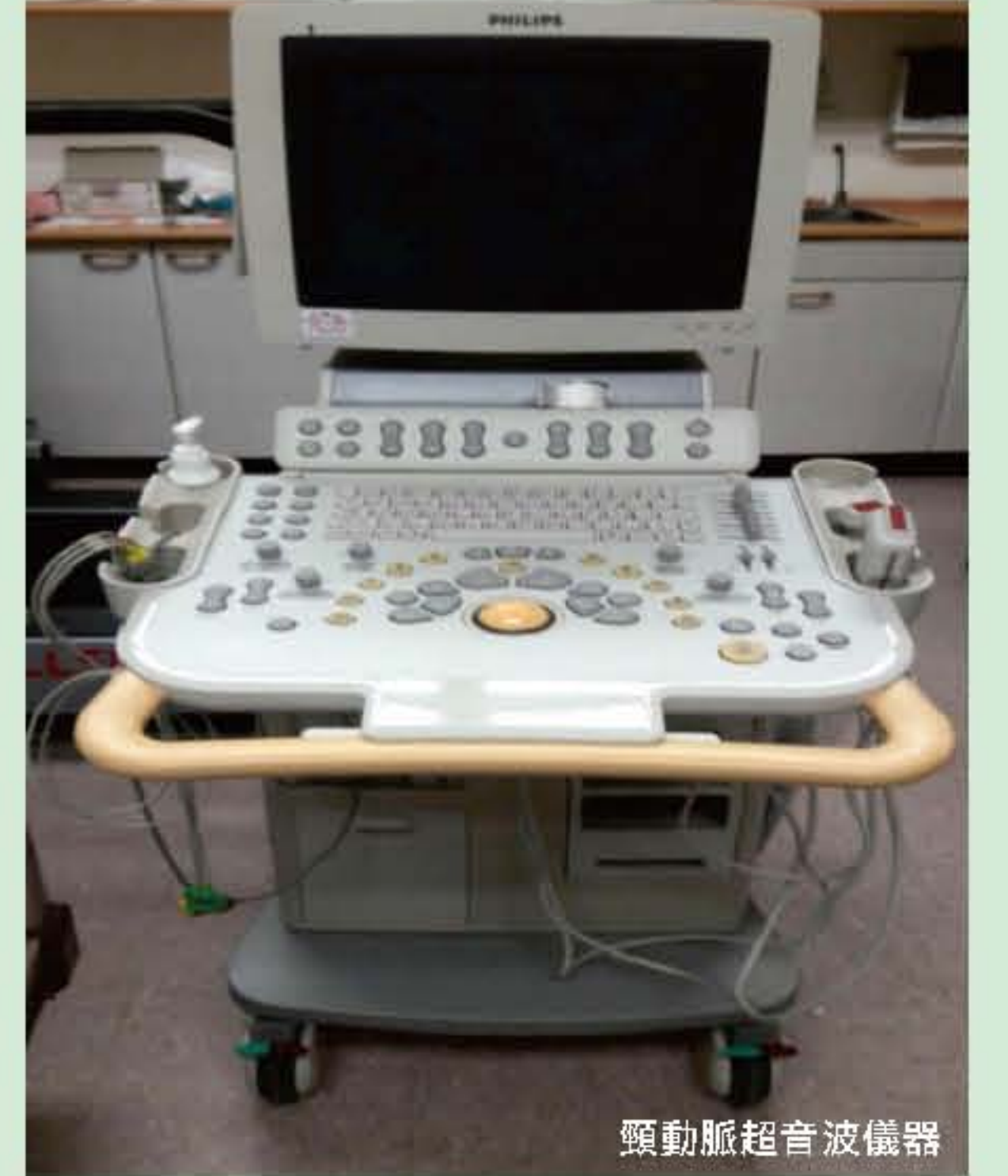
頸動脈超音波儀器