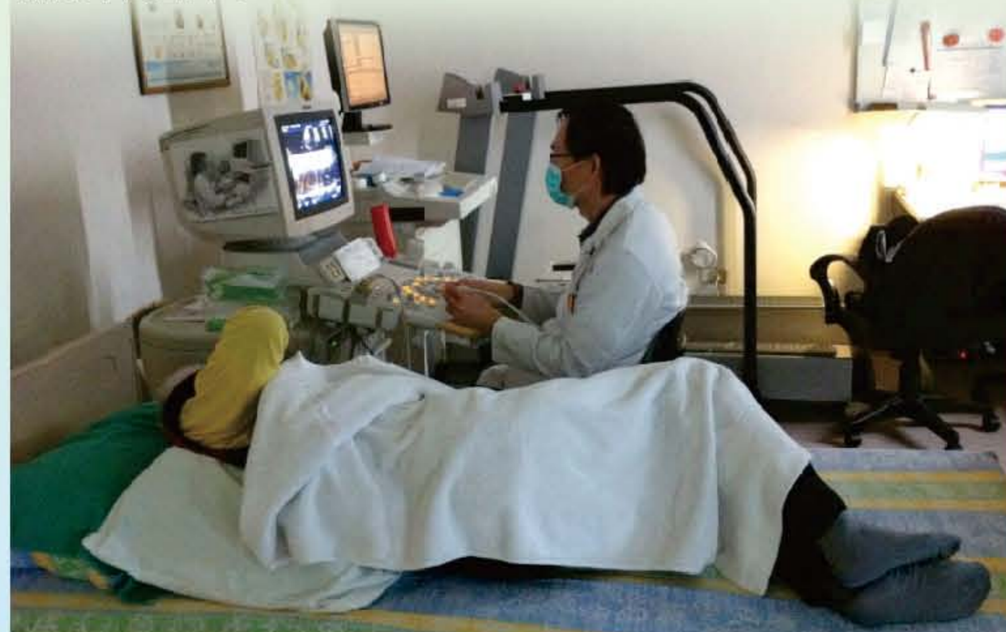
▲ 心臟超音波儀器檢查

急診室心臟超音波最常用來評估左心室功能，由雙面超音波算出的收縮率百分比(ejection fraction%)可信度很高。心室功能不良起因於缺氧性、非缺氧性心肌病變、瓣膜疾病或續發於其它藥物。雙面超音波上之局部心肌收縮異常，心肌肥厚，或瓣膜異常可解釋大部份病人心室功能不良之原因。如果病人有呼吸困難及由肺病變造成的右心衰竭，若超音波檢查左側心臟是正常的，則這類的病人可藉杜卜勒超音波測量三尖瓣閉鎖不全血流速度已評估肺高壓的嚴重度。此外心臟超音波可顯示肺動脈擴張，右心室肥厚，擴大或功能不良以及右心房擴大。所以心臟超音波可幫助醫師指出是否有心室功能異常並找出功能異常之原因。