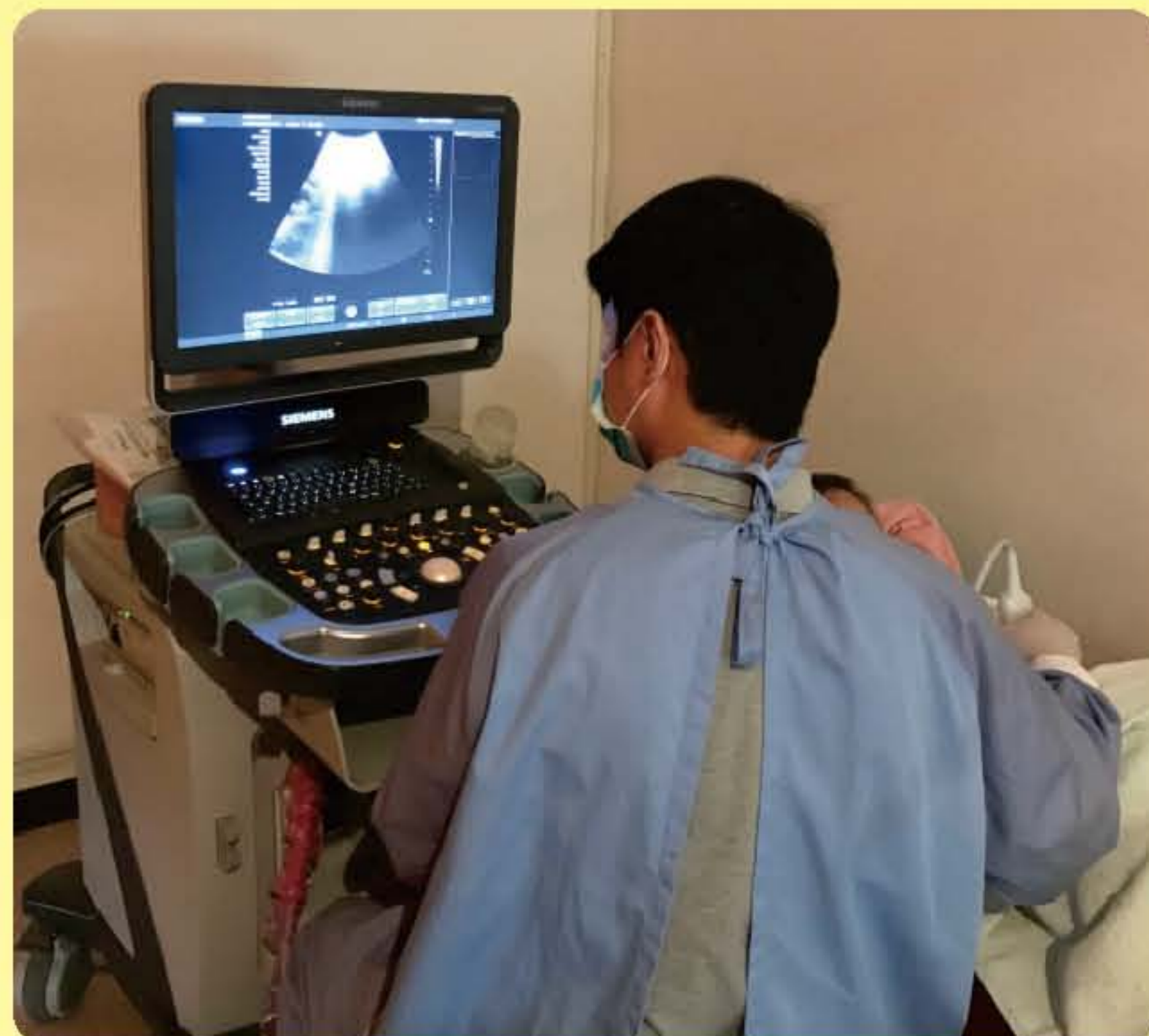
▲超音波檢查儀(適合檢查腹腔中各項實質器官，如肝、膽、胰、脾、腎)(超音波檢查過程示意圖)。