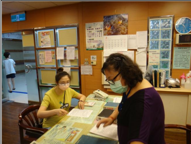
全程照顧(協助病患填寫同意書)