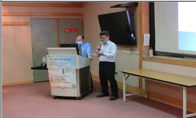
辦理溝通教育訓練課程