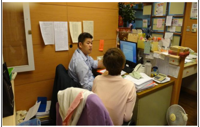
醫療爭議事件法律程序處理