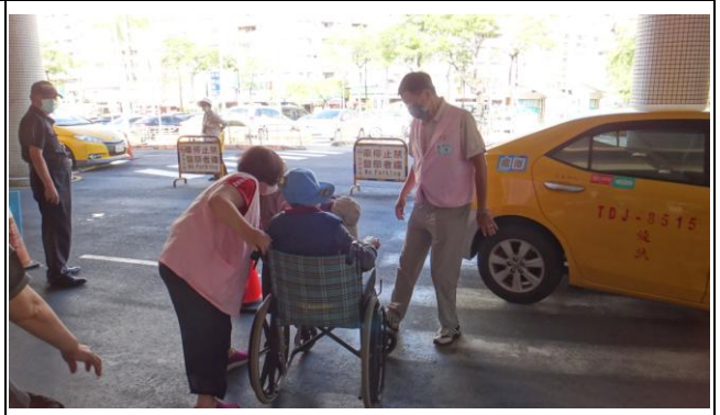
全程照顧(完成看診後協助至門口坐車)