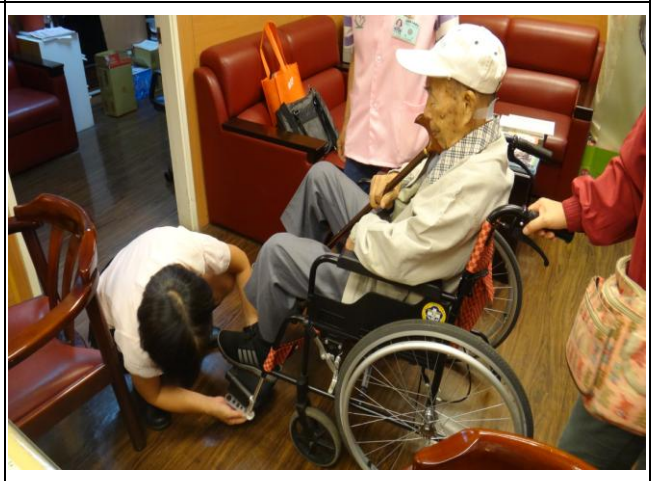
全程照顧(協助病患調整輪椅角度)