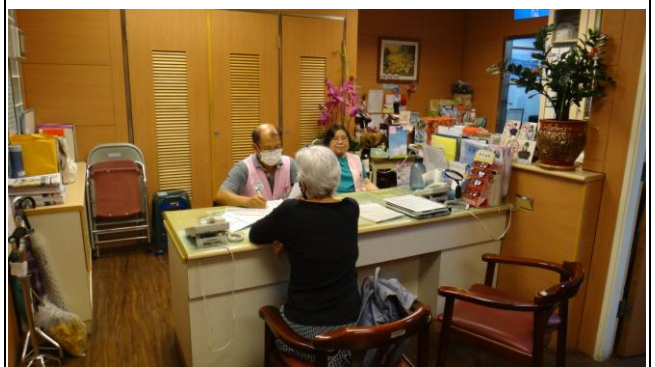
客服中心現場志工諮詢服務