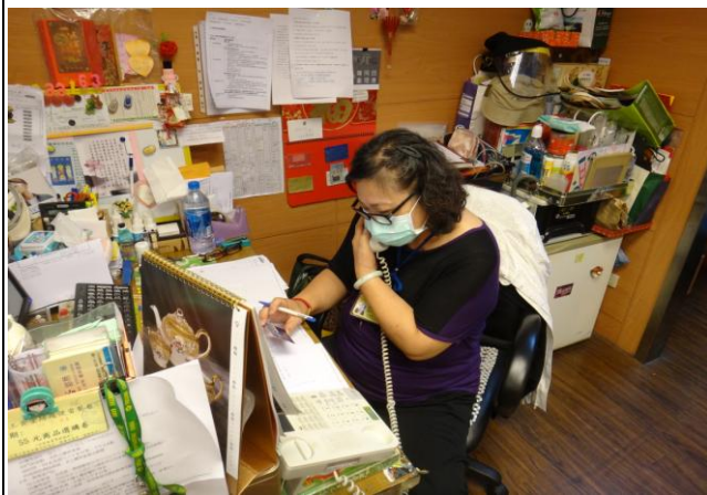
客服中心電話意見反映