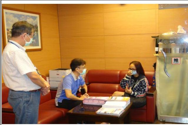
協助醫療抱怨處理