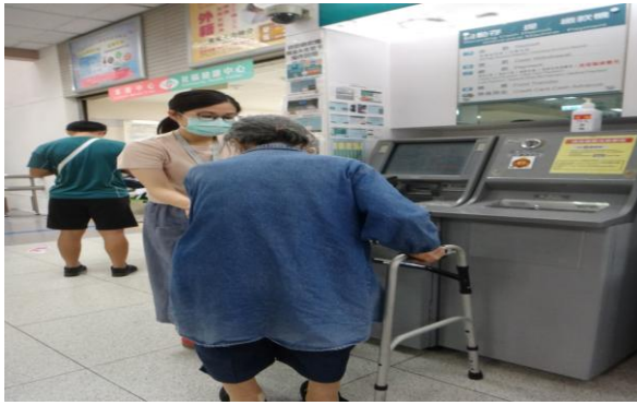
協助高齡長者 ATM 繳費服務