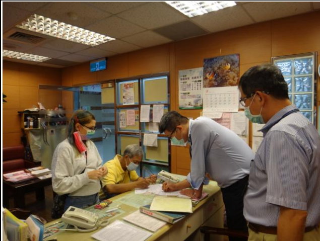
協助外籍人士就醫服務