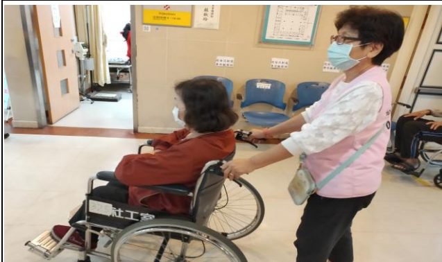
全程照顧(協助病患至診間看診)