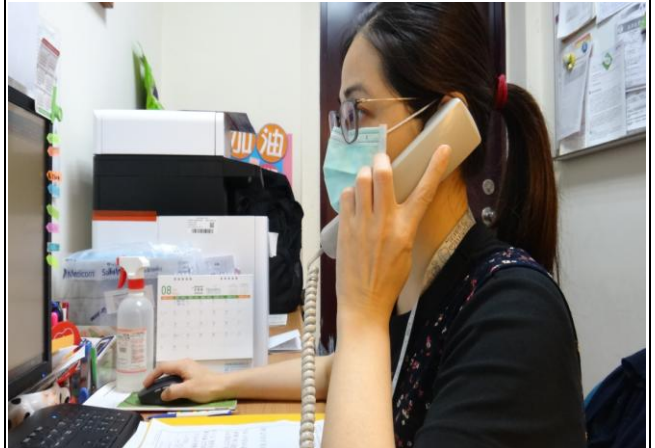
客服中心電話諮詢服務