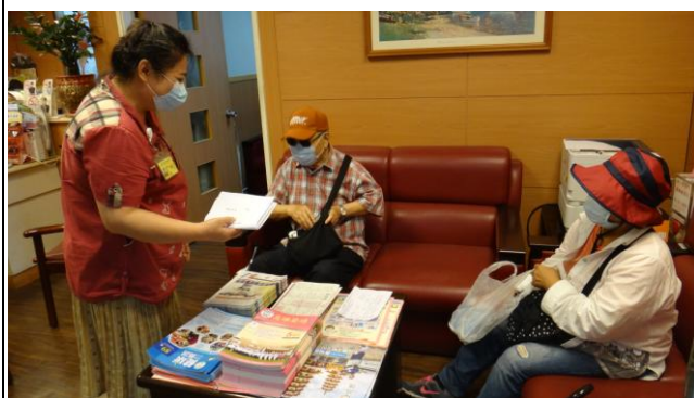
客服中心現場諮詢服務