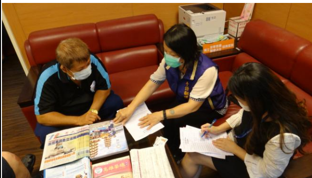
協助聽障人士就醫