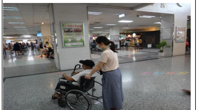
全程照顧(協助病患至診間看診)