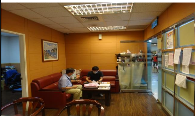
貧困病家就醫協助