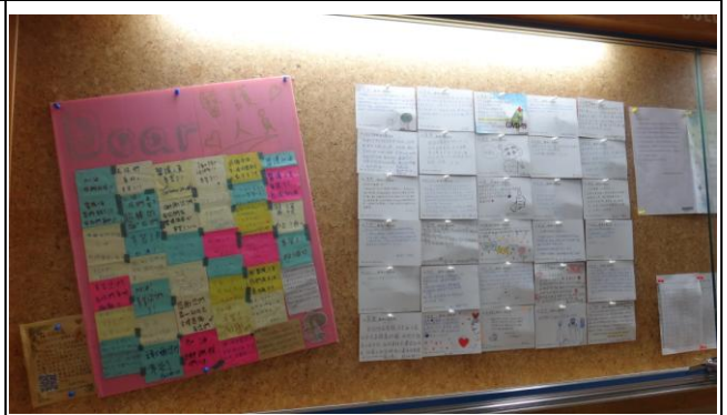
張貼防疫加油感謝函