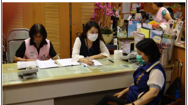
客服中心現場諮詢服務