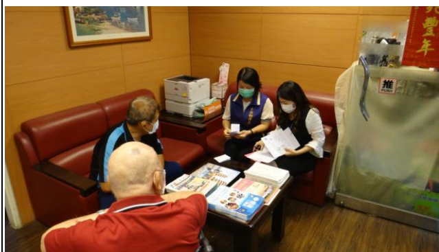
客服中心醫療諮詢服務