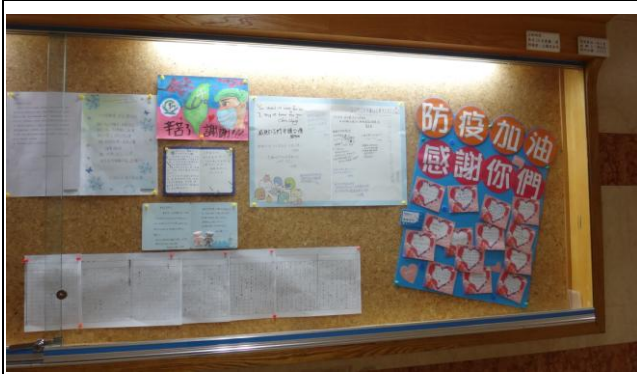
張貼防疫加油感謝函