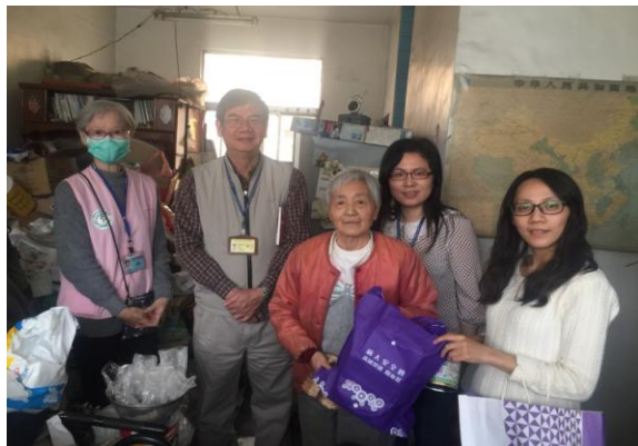
社區榮民居家探訪暨關懷活動