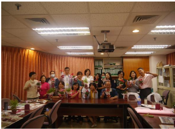
遺族哀傷關懷團體