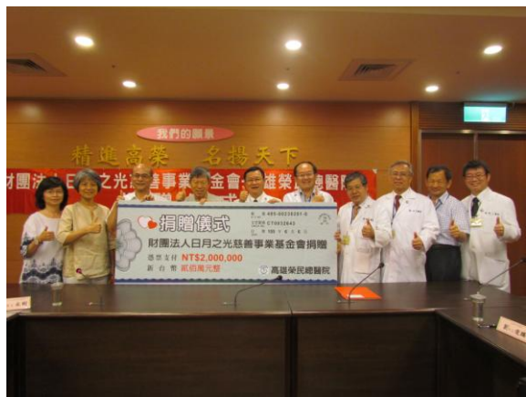
日月之光基金會捐贈醫療補助金