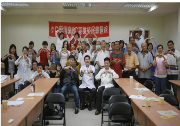
小口愛俱樂部病友會成立大會