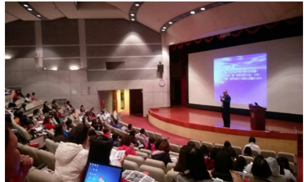
辦理長照 Level II 課程