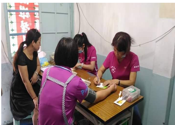
慕義巷社區關懷站三高檢測