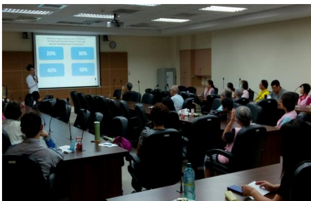
志工分組訓練-預防骨質疏鬆