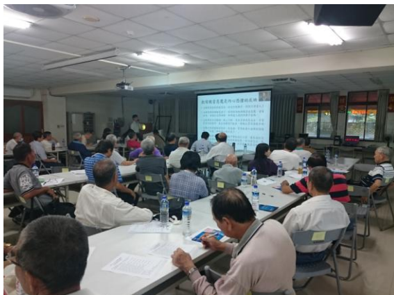
高雄榮服處健康講座