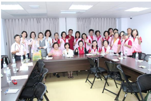
參訪台南奇美醫院