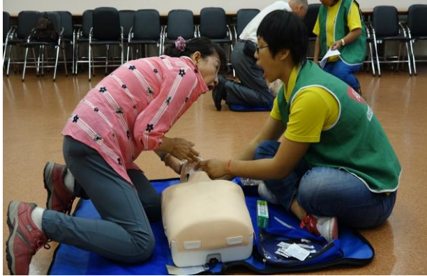
在職特殊訓練-CPR 急救教育