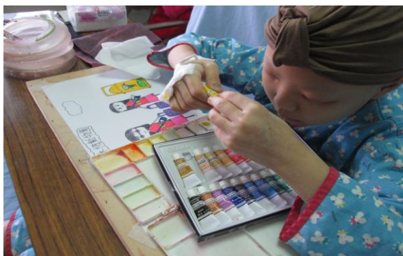
兒童病房藝術治療