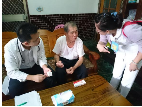
屏東竹田巡迴醫療關懷訪視