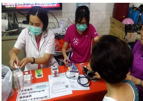
光輝里社區關懷站三高檢測