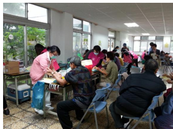
宏南社區成老人健康檢查