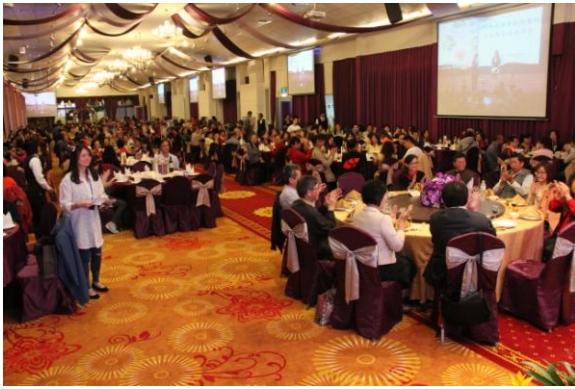
志工期末感謝聚餐