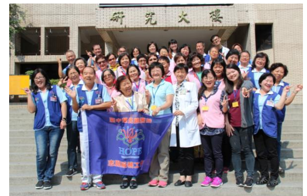
參訪台中榮民總醫院