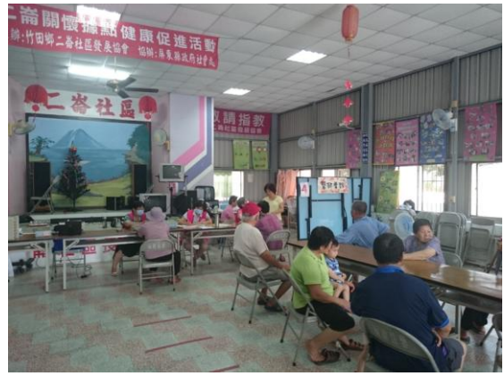
偏遠地區(屏東竹田)巡迴醫療