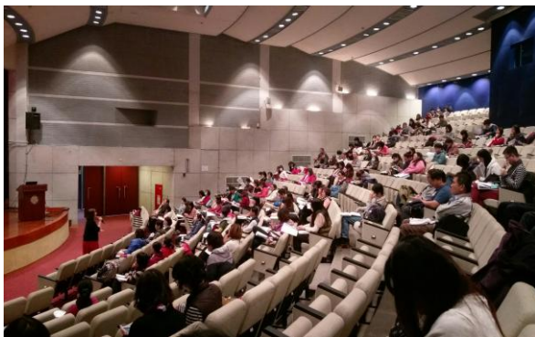
辦理長照 Level II 課程