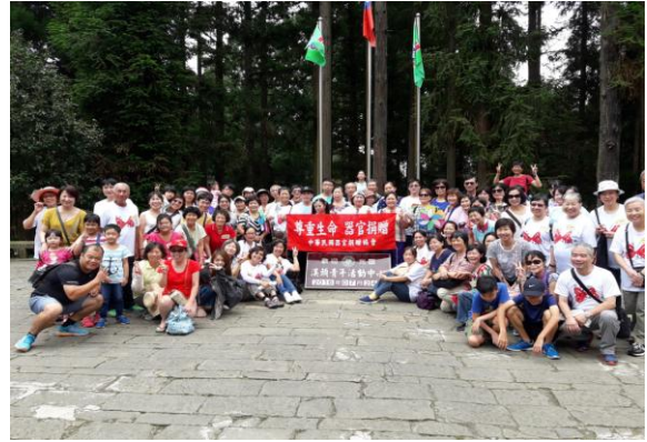
器捐家屬聯誼活動