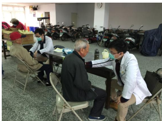
祥和山莊成老人健康檢查