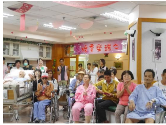
崇德病房-粽香樂端午