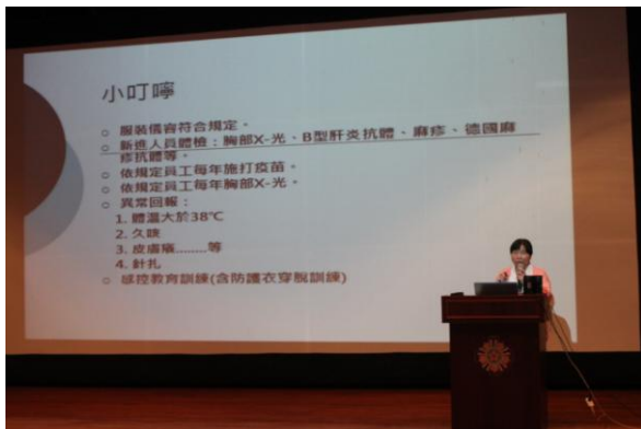
在職特殊訓練-感染管制