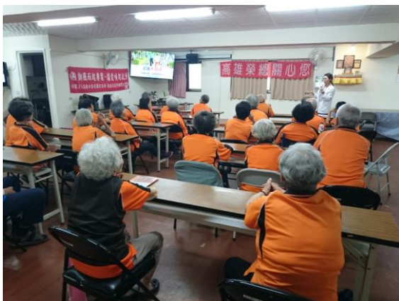
善護社區關懷據點健康講座