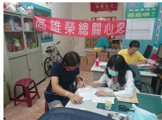
一甲里健康報告諮詢