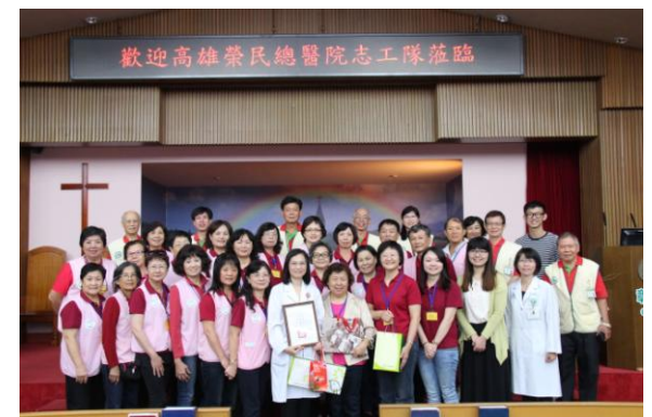
參訪彰化基督教醫院