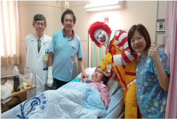
麥當勞叔叔醫院巡迴親善表演