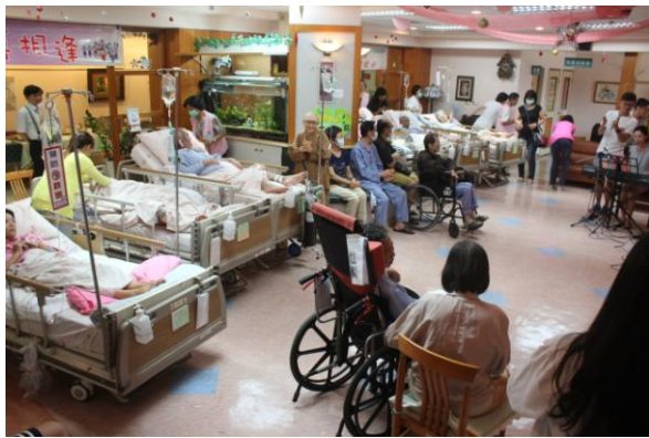
崇德病房-歡心喜相逢父親節