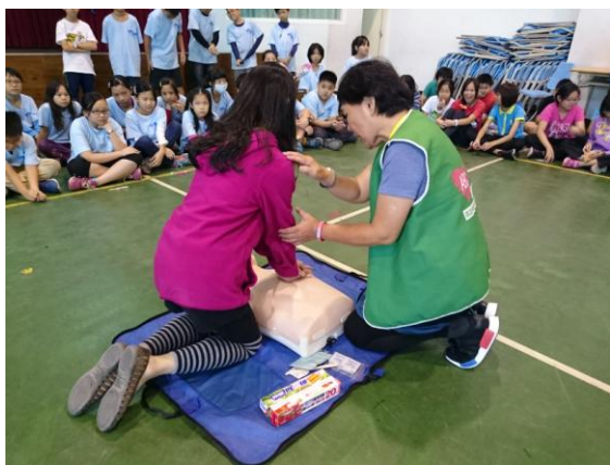
校園 CPR 教學