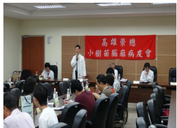
腦性麻痺小樹苗團體