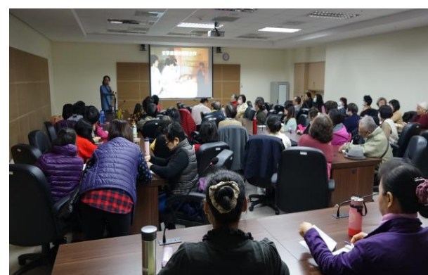
志工分組訓練-悲傷輔導