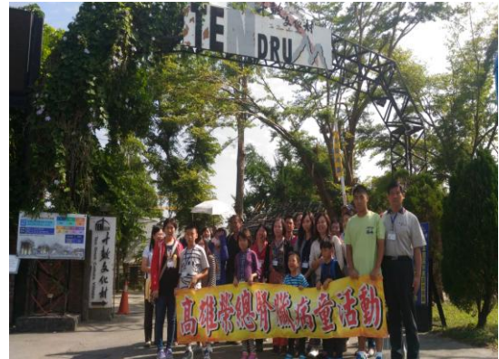
腎臟病童聯誼團體