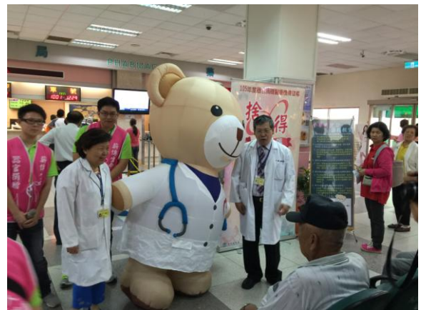
器官捐贈院內宣導