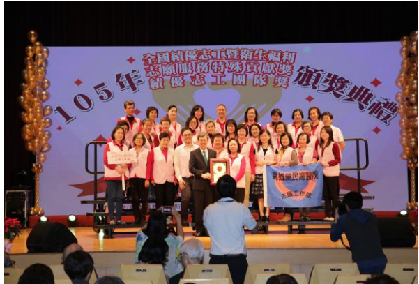
衛生福利部全國績優團隊獎