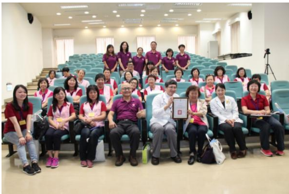
參訪中國醫藥大學附設醫院