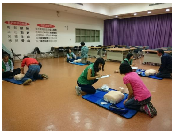
市民有約—社區民眾 CPR 教學