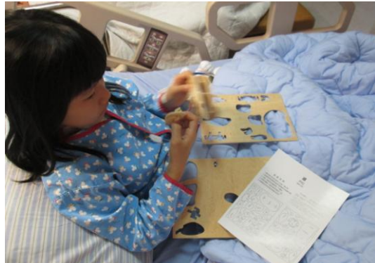
兒童病房藝術治療