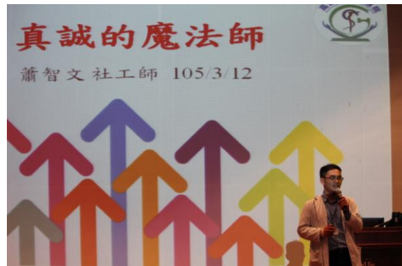
在職特殊訓練-服務禮儀