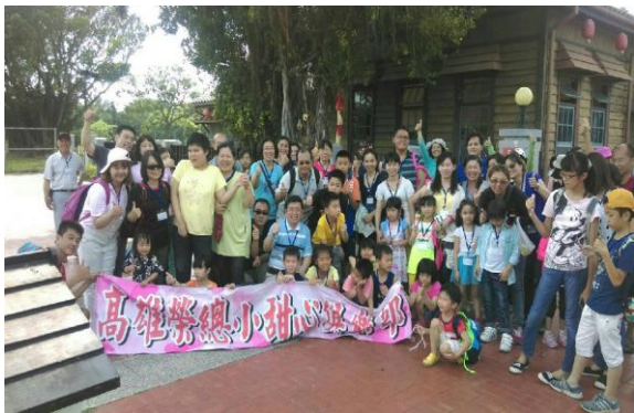
小甜心俱樂部-聯誼團體照