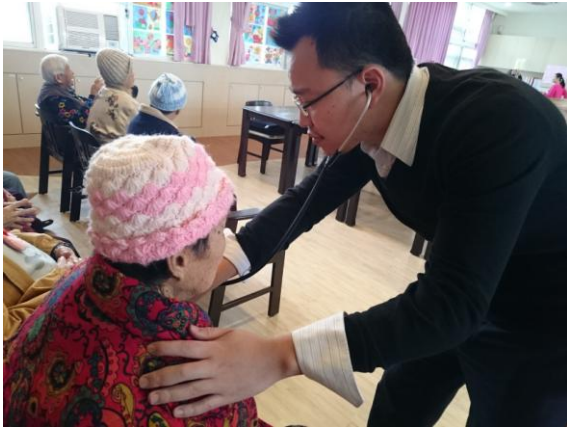
屏東九如巡迴醫療關懷訪視