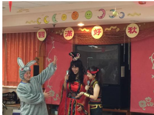
崇德病房-圓滿好秋情