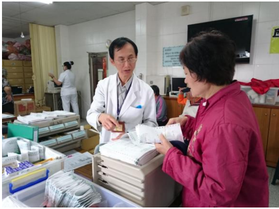
偏遠地區(屏東九如)巡迴醫療