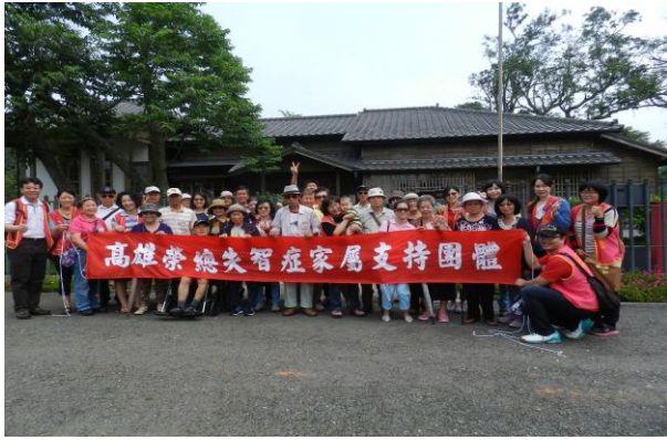
失智症病友家屬聯誼活動