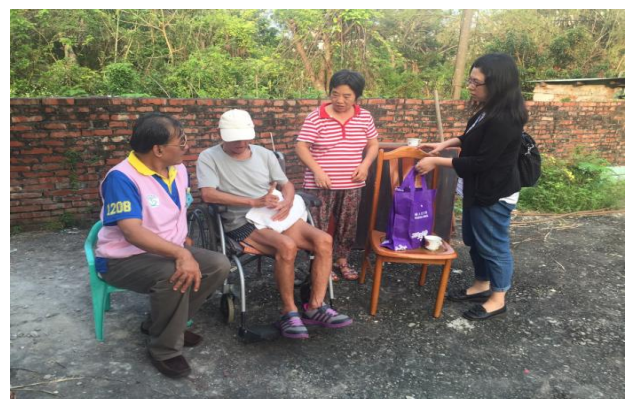
社區榮民居家探訪暨關懷活動