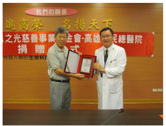
日月之光基金會捐贈醫療補助金