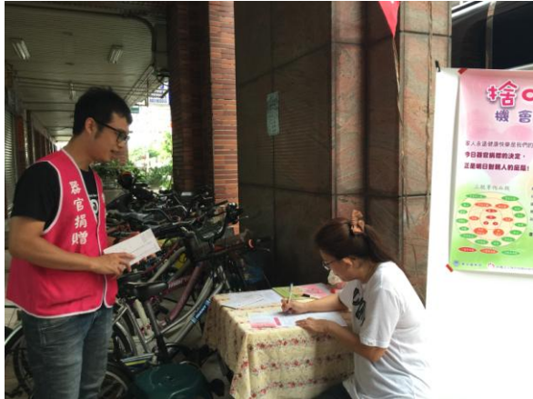
器官捐贈社區宣導