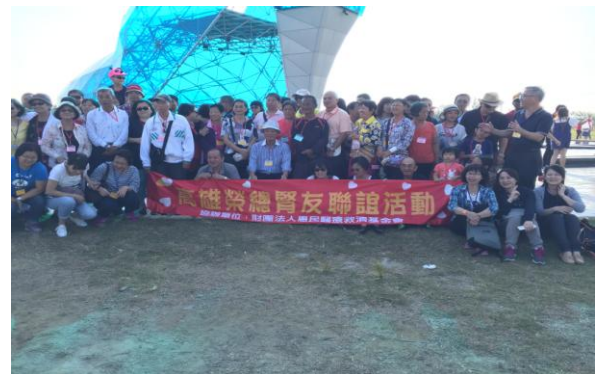
腎友醫學講座團體照