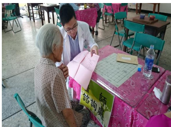
左營老人活動中心健康報告諮詢