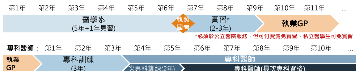
圖 錯誤! 所指定的樣式的文字不存在文件中。-3 泰國醫師制度圖

不過由於泰國有強制義務服務的規定，成為全科醫生後須先在公立醫院工作3年，之後才可自由選擇至私立醫院工作，或進一步取得專科資格。對於想取得專科資格的人，須到教學醫院或城市三級醫院接受3~5年的專科醫生訓練，相當於研究所課程，合格後會由泰國醫學委員會頒發專科醫生職業資格證書，在學歷上成為醫學博士(PhD)，即可自由擇業。