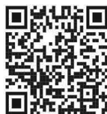
衛生福利部疾病管制署