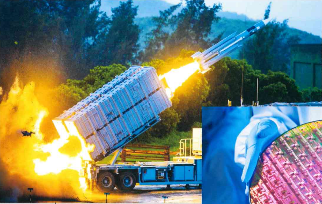
基於國防需要研發的技術或可促使我國產生領導型的技術皆為關鍵技術的範疇，如具備衝壓引擎技術的超音速反艦飛彈或半導體積體電路製造技術。