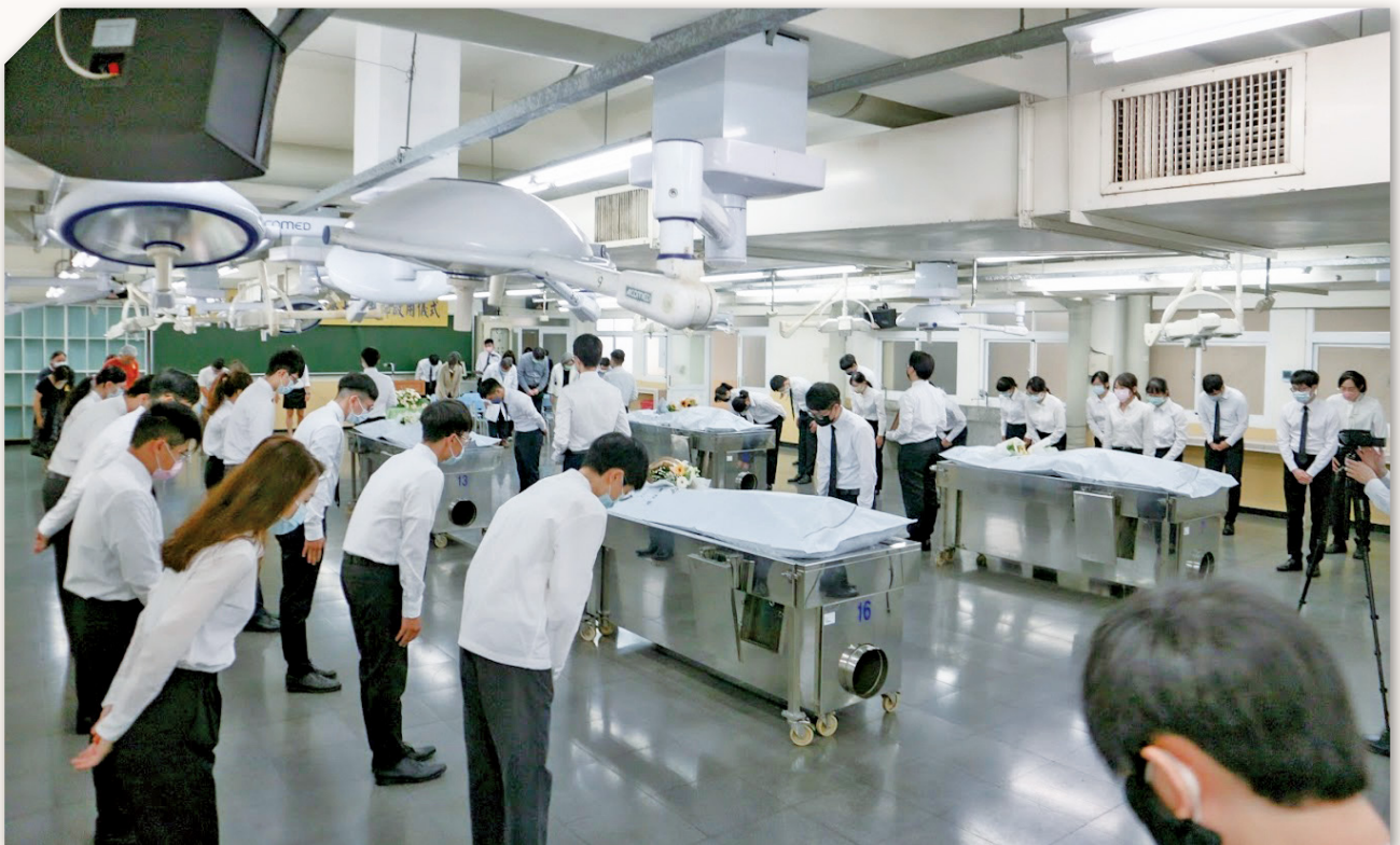
捐贈大體提供醫學院學生進行專業培訓，成為人類生命存續的基石，也讓生命的盡頭成為另一個生命的起點。 (圖片來源：高雄醫學大學， https://smedana.kmu.edu.tw/index.php/zh-tw/ 大體儀式紀錄 /31- 大體儀式紀錄 /59-110 學年度學士後醫學系解剖教學啟用儀式)

器官捐贈與大體捐贈稍有不同，器官捐贈又分成往生後器官捐贈及活體捐贈。往生後器官捐贈者是腦死後，將良好的器官或組織，無償捐贈給器官衰竭、急需器官移植的患者，而活體捐贈則是捐出自己的分器官或組織，移植給親屬或配偶使用。