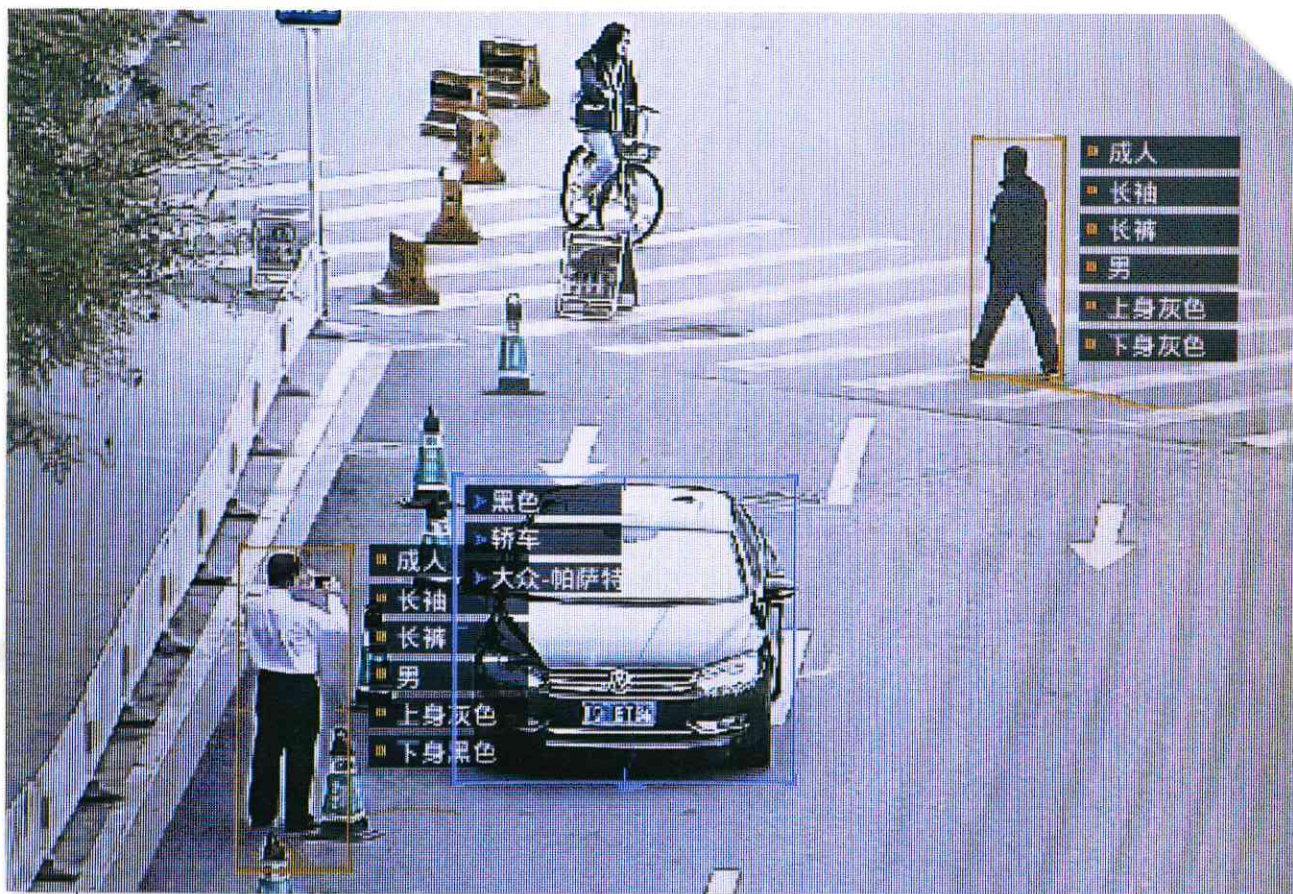
除了運用「人」的監控，中共也結合科技強化監控、蒐情的效率，如銳眼、安全城市和天網等監控工程。

大陸官媒《人民網》近日更讚許作為「楓橋經驗」發源地之一的楓橋鎮楓源村，連續 18 年實現「群眾零上訪、幹部零違紀、百姓零刑事、村民零邪教」，變相鼓勵地方官員及早壓制地方矛盾，避免民眾上訪造成中央的困擾。