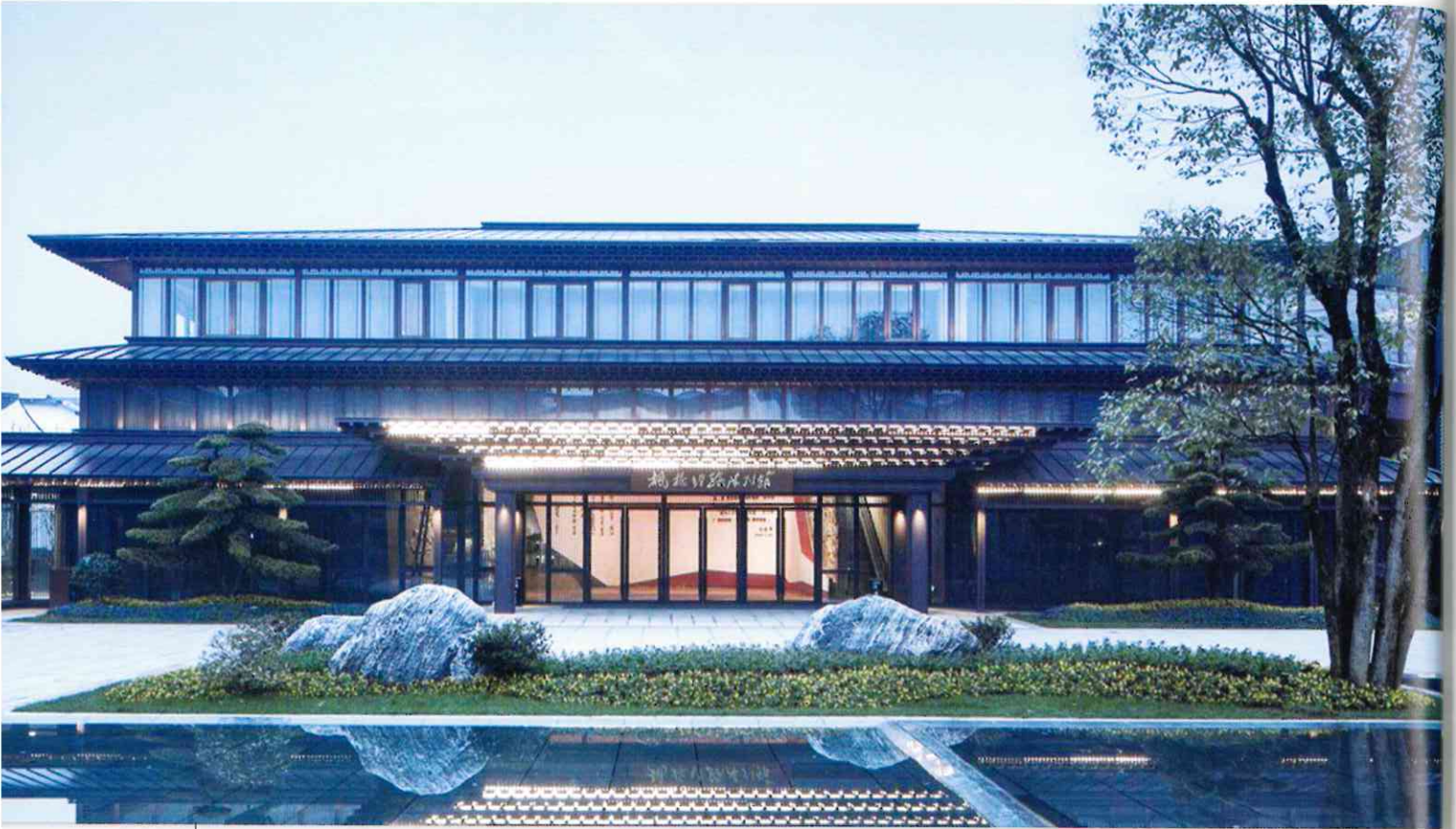
2018 年為配合「楓橋經驗」55 週年紀念大會而新建的「楓橋經驗陳列館」，被列為浙江省紹興市「十大紅色旅遊景區」。(Photo Credit: ArchDaily, UAD, https://www.archdaily.cn/cn/918854/feng-qiao-jing-yan-chen-lie-guan-zhe-jiang-da-xue-jian-zhu-she-ji-yan-jiu-yuan-jian-zhu-jiu-yuan?ad_medium=gallery )

需求，但實際狀況卻演變成對民眾的全面監控與壓制，以「網格化」管理形成異常嚴密的維穩系統，甚至阻擋民眾「上訪」陳情。大陸部分地區建立自派出所到群眾家門口的聯絡線，分成不同的警務站或警務點管理，達到不用派出大批警察就能及時處理群眾事件的方式。部分城市亦大量聘僱「網格員」，分層監控城市居民，例如河南省開封市建立 3,858 個一級網格、8,500 個二級網格，配備專（兼）職網格員 3.2 萬餘名，全市「零上訪」、「零事故」、「零案件」的「三零」績效綜合成績使其近 2 年在河南省的評比名列前茅，深獲中共的嘉許。