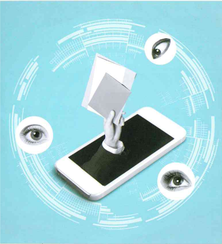
電腦、智慧電視和手機使用之網路管控使中共得以遠程監控人民，並對社群媒體內容進行監視與封鎖。