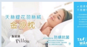
防蹣抗菌枕芯 $180 (金沙枕)