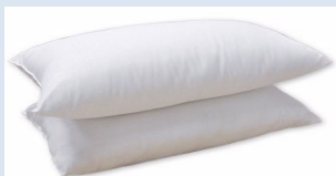
基礎型枕頭 $110 (扎實型)