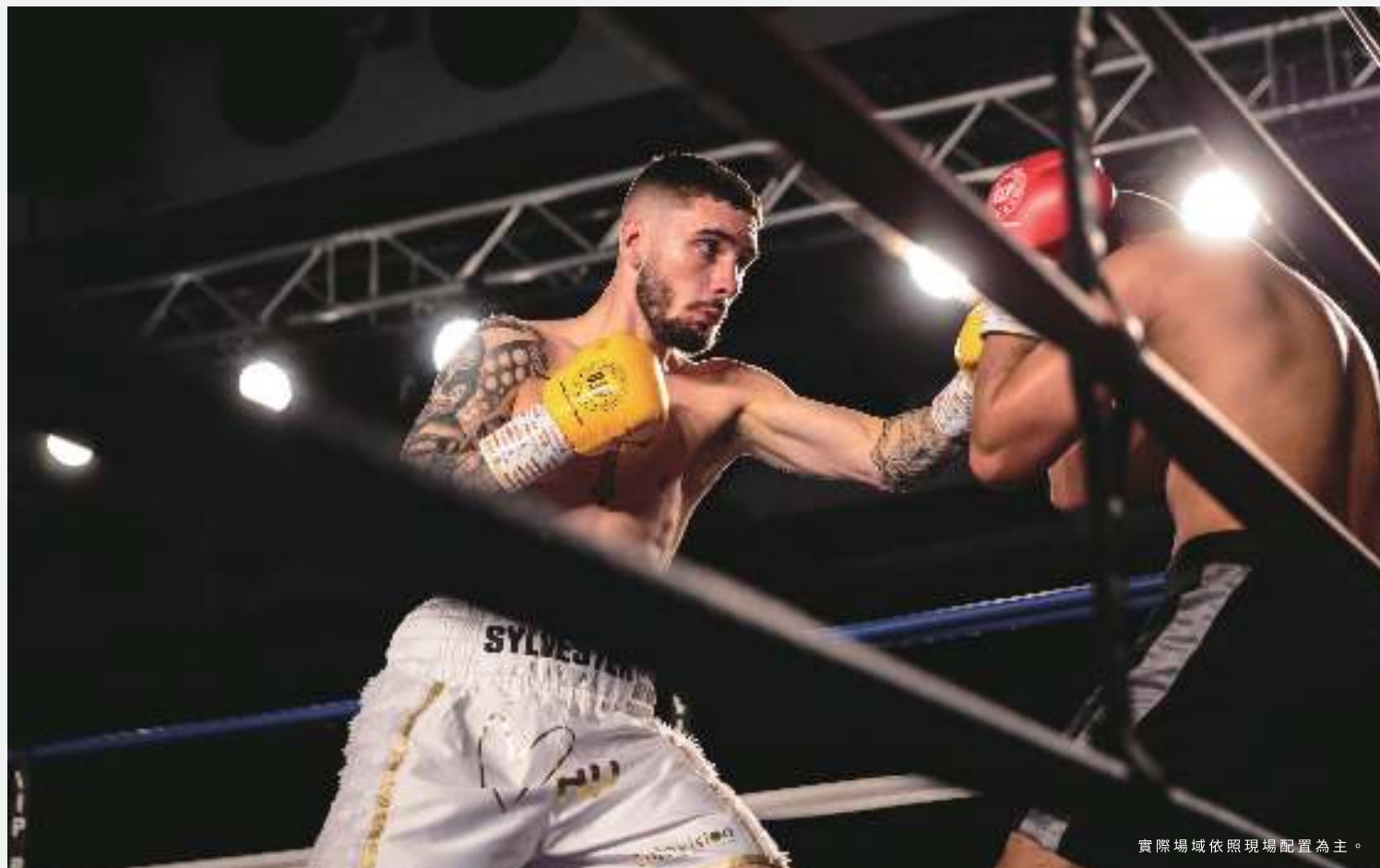
實際場域依照現場配置為主。

健身對重視生活品味的旅人而言，從來都不只是一個生活習慣，旅人自旅程開始的每一步都在實踐自己的生活態度，承億酒店首創將八角籠拳擊場引進健身房，打造全台獨一無二的高空健身視野，兼具運動專業與生活品味的健身空間，體驗旅程打出 Punch Out 精彩一戰。