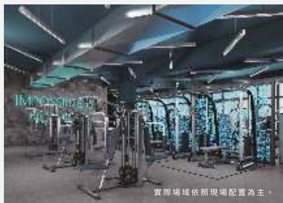
實際場域依照現場配置為主。

健身對重視生活品味的旅人而言，從來都不只是一個生活習慣，旅人自旅程開始的每一步都在實踐自己的生活態度，承億酒店首創將八角籠拳擊場引進健身房，打造全台獨一無二的高空健身視野，兼具運動專業與生活品味的健身空間，體驗旅程打出 Punch Out 精彩一戰。