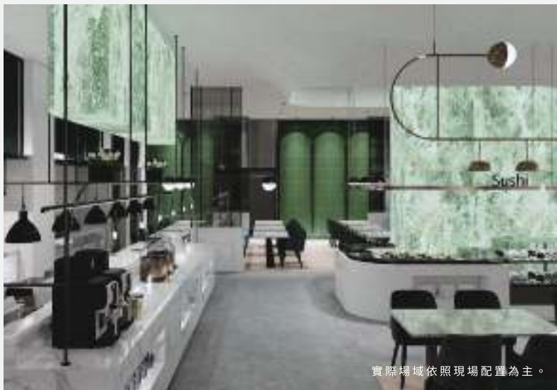
實際場域依照現場配置為主。