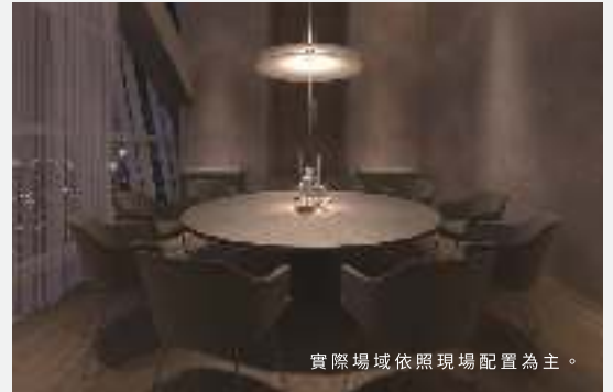
實際場域依照現場配置為主。