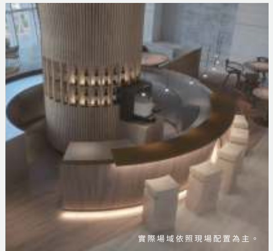
實際場域依照現場配置為主。