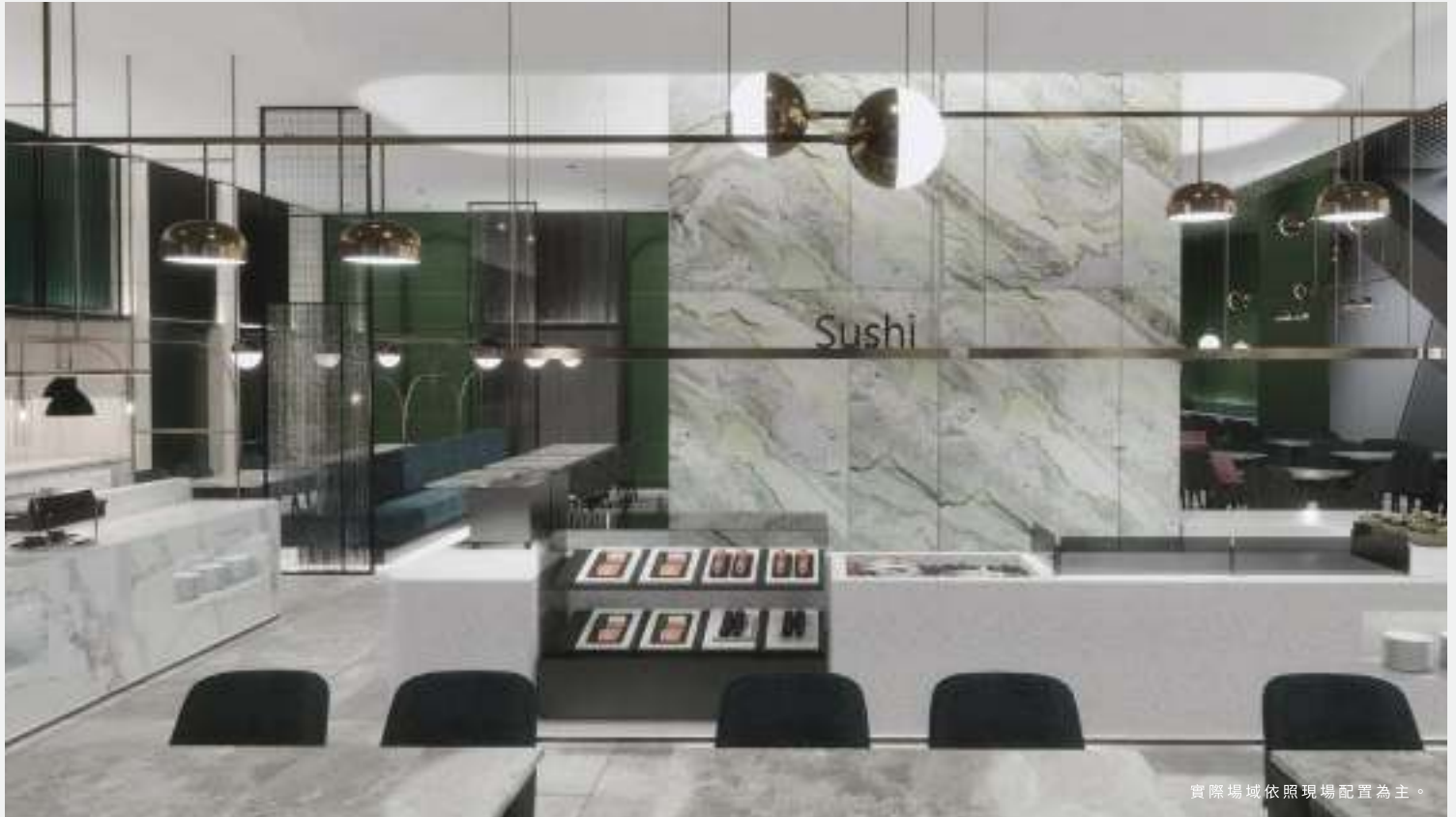
實際場域依照現場配置為主。