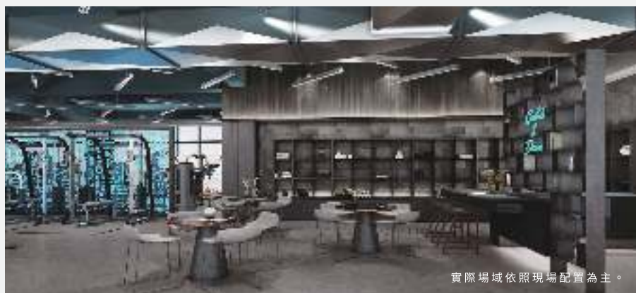
實際場域依照現場配置為主。