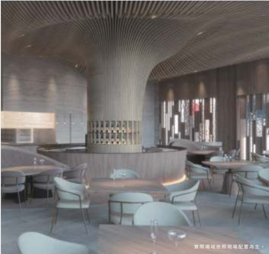
實際場域依照現場配置為主。