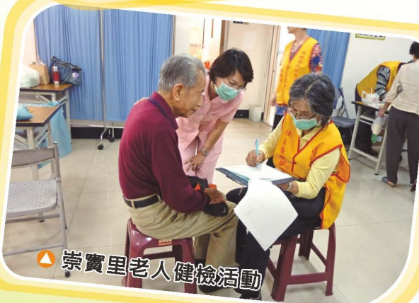
▲崇實里老人健檢活動