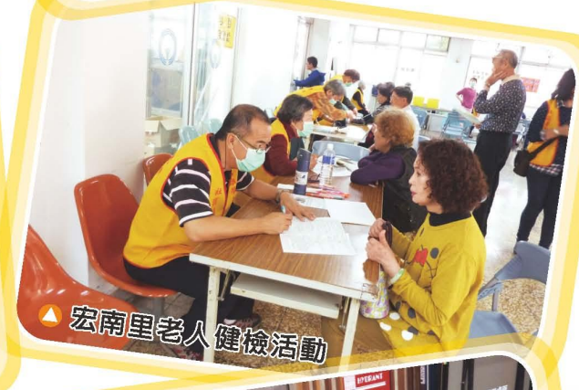
▲宏南里老人健檢活動