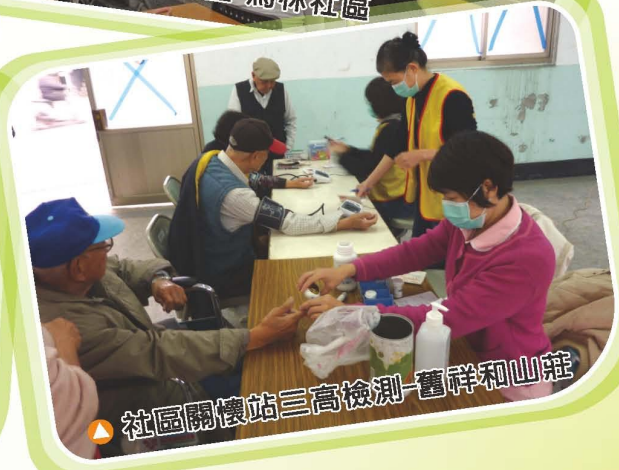
▲ 社區關懷站三高檢測-舊祥和山莊