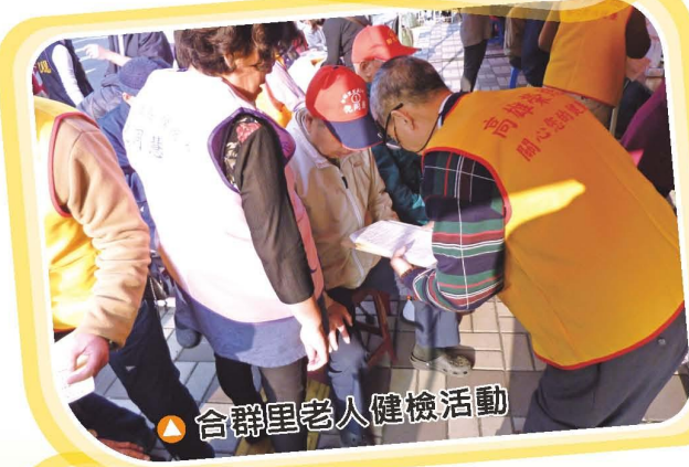
▲合群里老人健檢活動