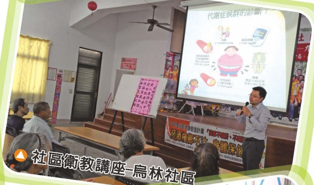
▲ 社區衛教講座-烏林社區