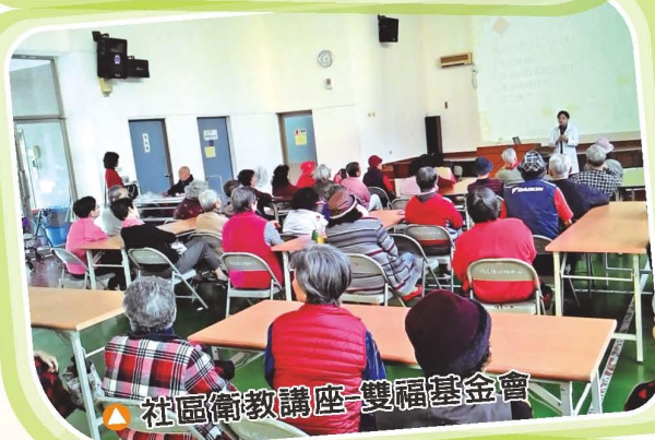
▲ 社區衛教講座-雙福基金會