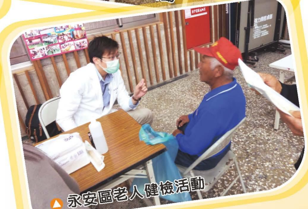
▲永安區老人健檢活動