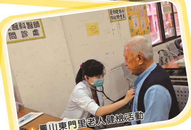
▲鳳山東門里老人健檢活動