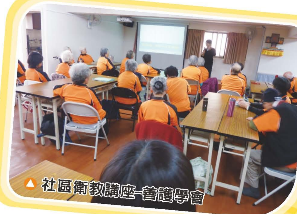
▲社區衛教講座-善護學會