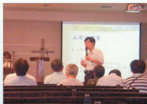
舊城長青衛教講座