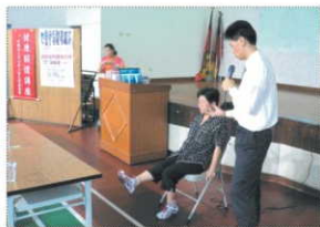
愛基會-銀髮族的運動保健