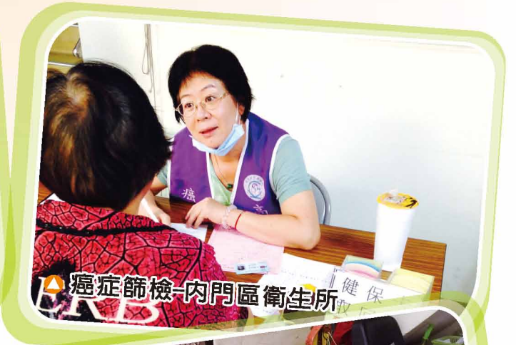
▲ 癌症篩檢-內門區衛生所