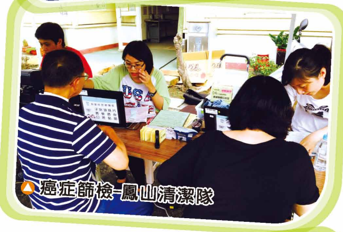
▲ 癌症篩檢-鳳山清潔隊