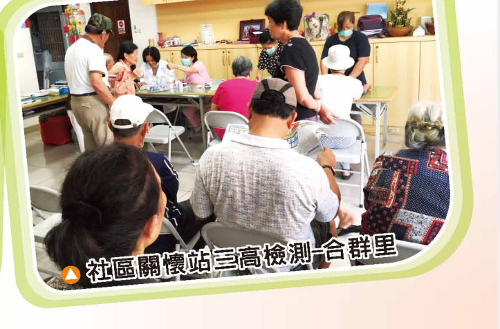
▲ 社區關懷站三高檢測-合群里