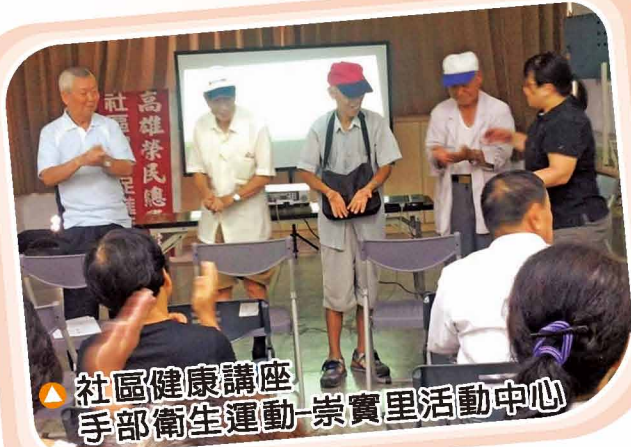
▲ 社區健康講座 手部衛生運動-崇實里活動中心