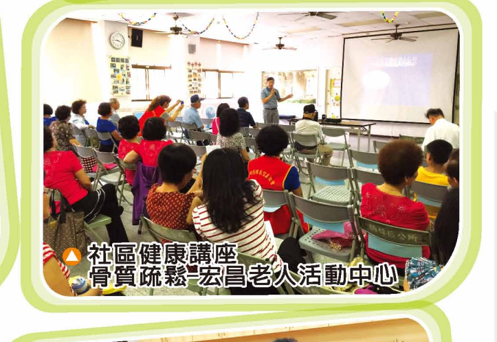
▲ 社區健康講座 骨質疏鬆-宏昌老人活動中心