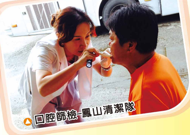
▲ 口腔篩檢-鳳山清潔隊