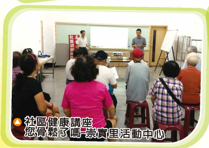
▲ 社區健康講座 您骨鬆了嗎-崇實里活動中心