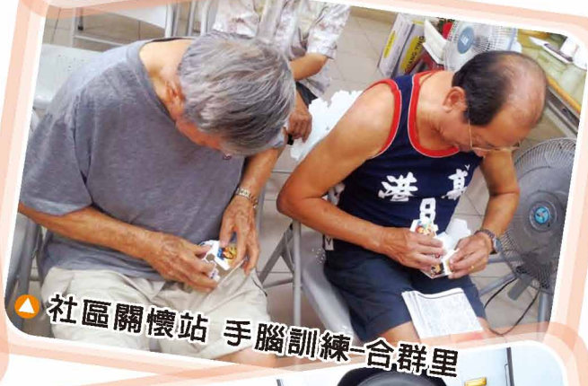
▲ 社區關懷站 手腦訓練-合群里