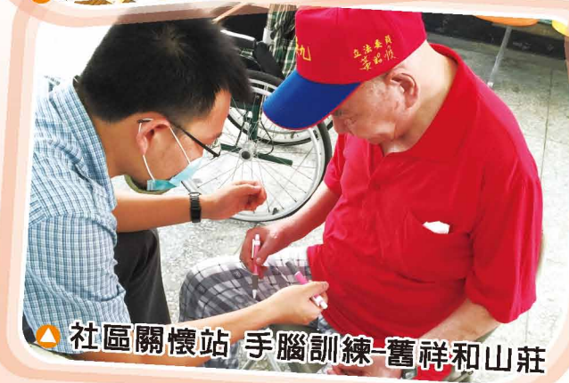
▲ 社區關懷站 手腦訓練-舊祥和山莊