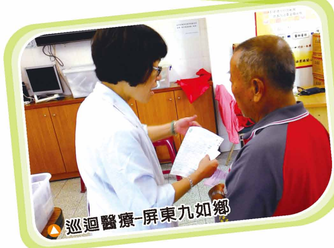
▲ 巡迴醫療-屏東九如鄉