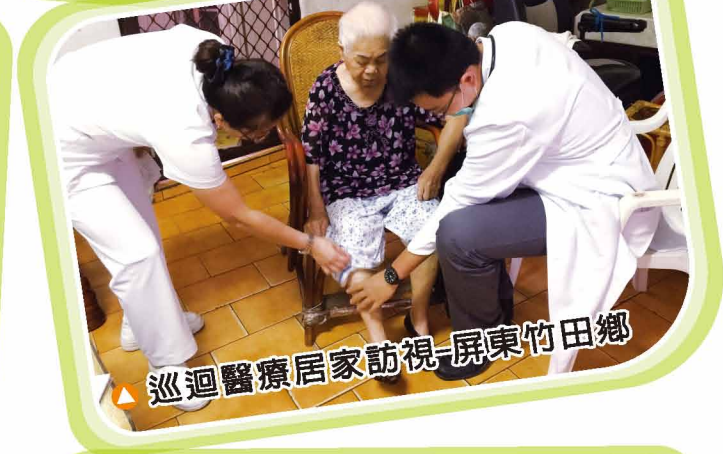
▲ 巡迴醫療居家訪視-屏東竹田鄉