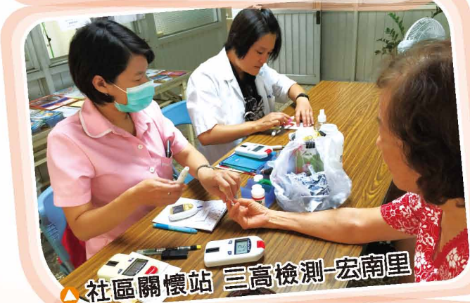
▲ 社區關懷站 三高檢測-宏南里