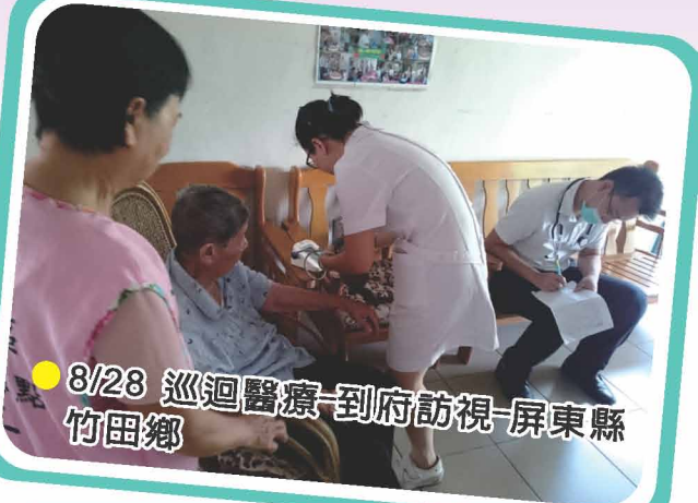
● 8/28 巡迴醫療-到府訪視-屏東縣竹田鄉