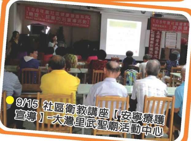
● 9/15 社區衛教講座【安寧療護宣導】-大灣里武聖廟活動中心