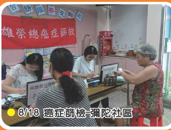
● 8/18 癌症篩檢-彌陀社區