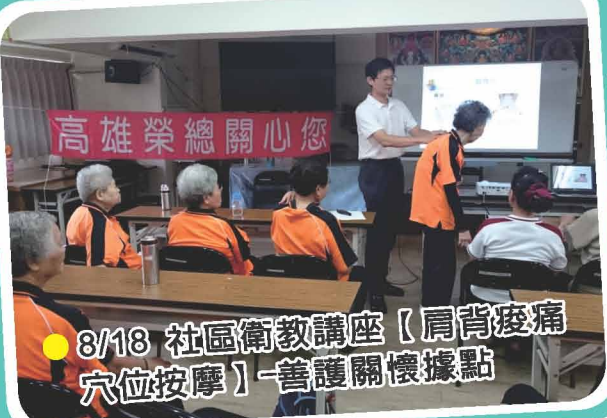
● 8/18 社區衛教講座【肩背痠痛 穴位按摩】-善護關懷據點