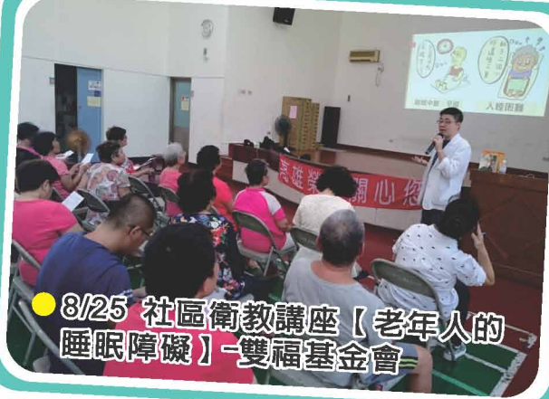
● 8/25 社區衛教講座【老年人的睡眠障礙】-雙福基金會