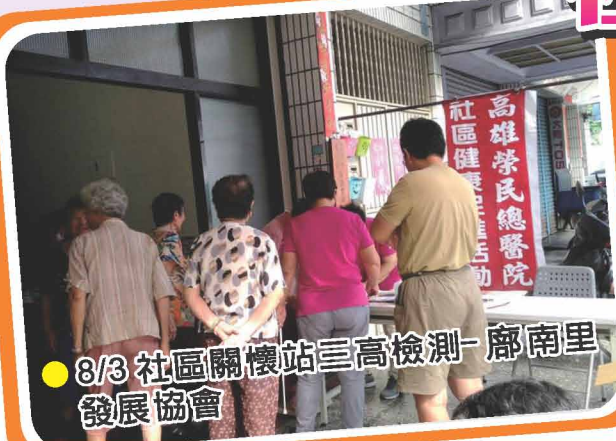
● 8/3 社區關懷站三高檢測- 廊南里發展協會