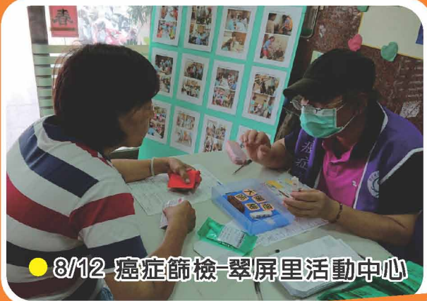
● 8/12 癌症篩檢-翠屏里活動中心