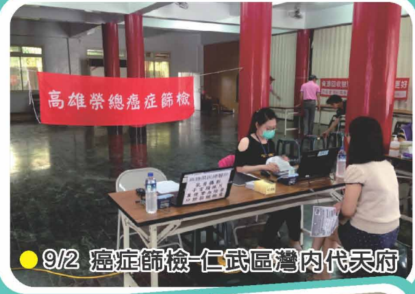
● 9/2 癌症篩檢-仁武區灣內代天府