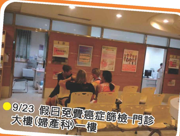
● 9/23 假日免費癌症篩檢-門診大樓(婦產科)一樓