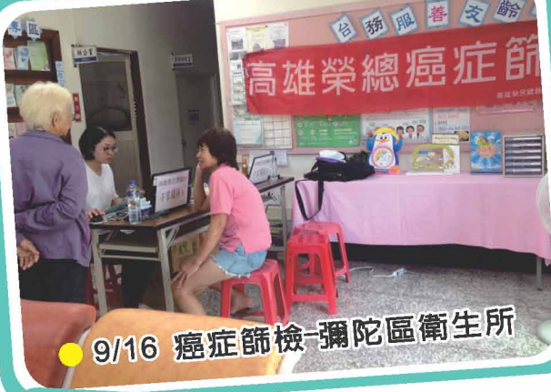
● 9/16 癌症篩檢-彌陀區衛生所