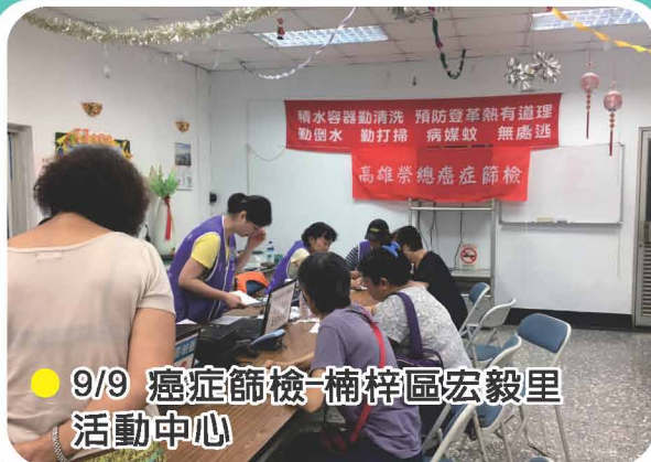
● 9/9 癌症篩檢-楠梓區宏毅里活動中心