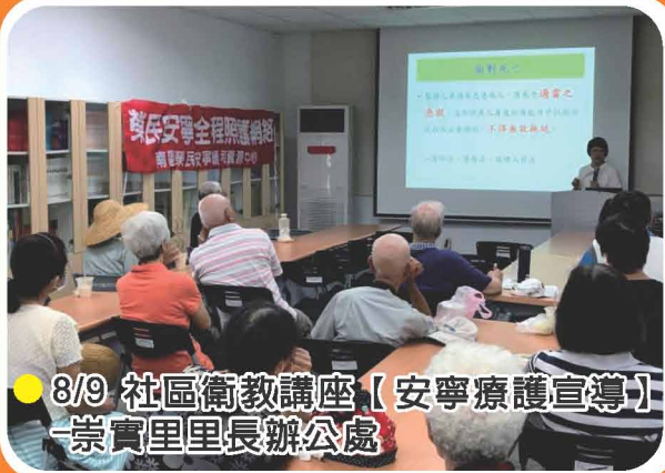
● 8/9 社區衛教講座【安寧療護宣導】-崇實里里長辦公處