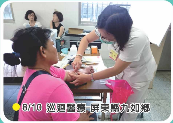
● 8/10 巡迴醫療-屏東縣九如鄉