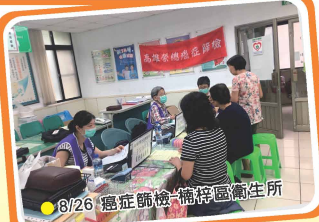
● 8/26 癌症篩檢-楠梓區衛生所