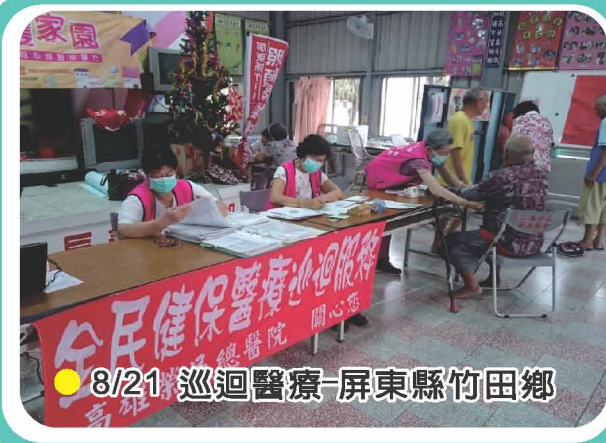
● 8/21 巡迴醫療-屏東縣竹田鄉