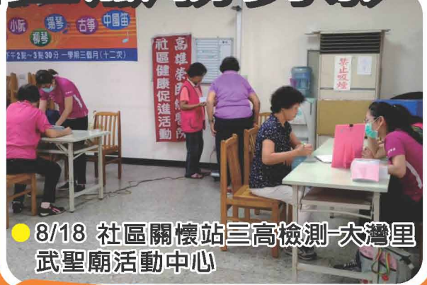
● 8/18 社區關懷站三高檢測-大灣里武聖廟活動中心