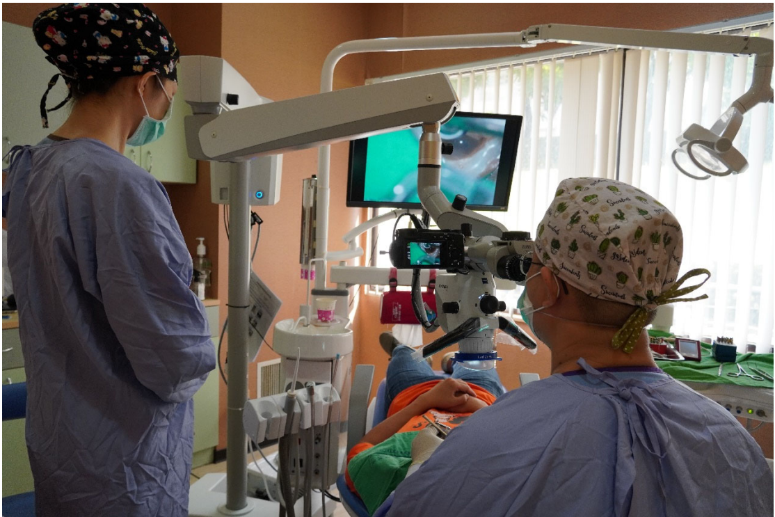
▲屏東榮總採用顯微鏡進行根管治療，醫師能更清楚的看到病灶精準治療。