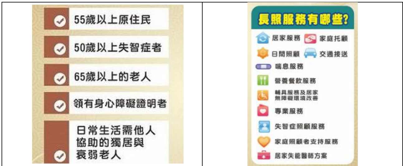
圖一、符合長照申請資格