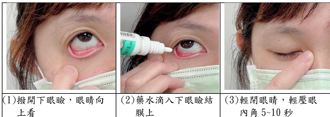
圖一、點眼藥水步驟