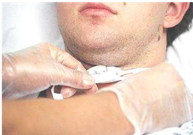
【图 5】替换气切造口系带，在新的系带固定前不可将旧系带移除