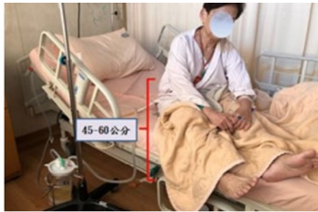
圖五 瓶低於胸腔 45~60 公分位置