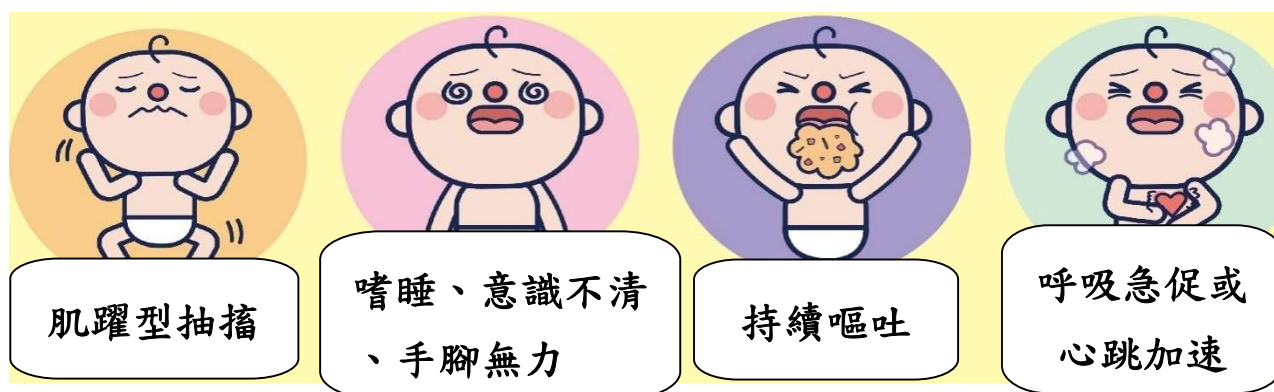
圖三腸病毒重症症狀

一旦出現重症狀況，例如：肢體無力麻痺、嗜睡、意識不清、活動力不佳、手腳無力、肌躍型抽搐(全身肢體突發式顫抖，類似受到驚嚇的動作)、持續嘔吐與呼吸急促或心跳加快等前兆(如圖三)，請盡速送至醫院求治。