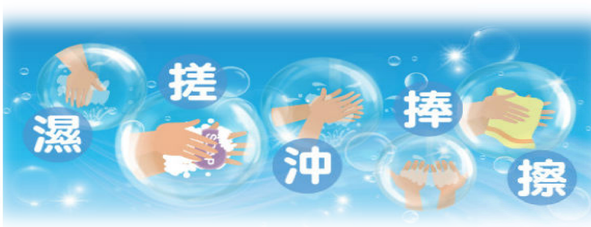
圖四 洗手五步驟