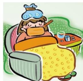
頸部淋巴結壓痛且腫大