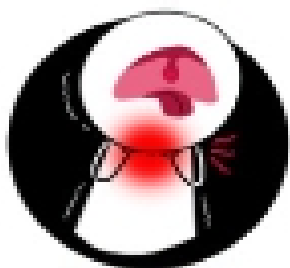
扁桃腺之表面會出現軟呈灰白色的滲出液-膿瘍