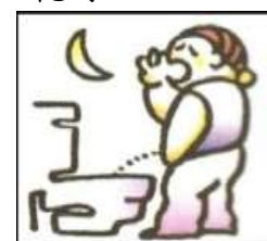
排尿次數增加，尤其是夜間睡眠時。