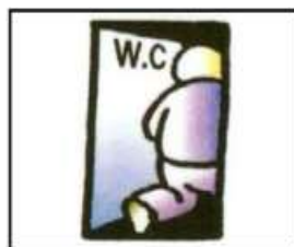
小便後仍覺尿液感。