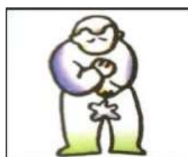
尿急時無法控制而流出。