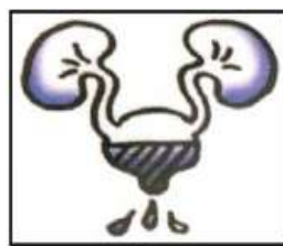
尿流變細且微弱無力，有時會中斷。