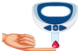
糖尿病者 控制血糖