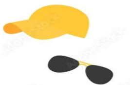
戴防曬衣物 減少紫外線的曝曬